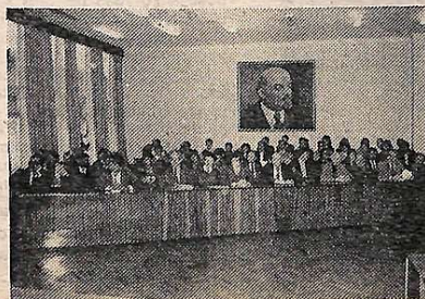
На знімках: під час проведення олімпіади.