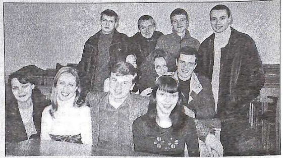
Ну й весела ж група ця ВВ-52!

Міжнародний день студента — це день відмінників і двієчників, зразкових студентів та тих, кого називають зірвіголовами. Це свято, коли всі студенти згадують про те, що їх єднає. А єднає їх гордий і високий статус (який, безумовно, треба виправдовувати), лекції і практичні, іспити, насичені студентські будні та веселі і неповторні студентські свята.