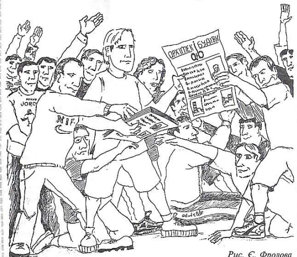
Рис. С. Фролова