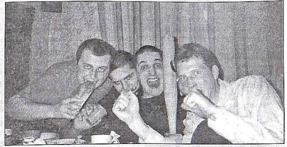
На свято поспішайте до гуртожитку № 5