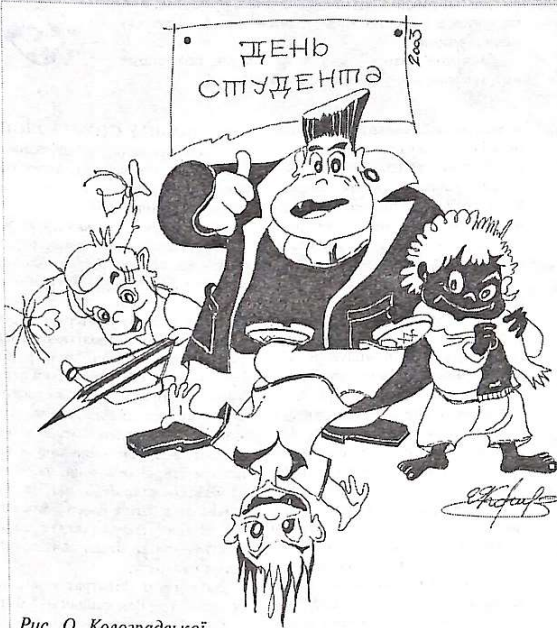
Рис. О. Колоградської

Міжнародний день студента — це день відмінників і двієчників, зразкових студентів та тих, кого називають зірвіголовами. Це свято, коли всі студенти згадують про те, що їх єднає. А єднає їх гордий і високий статус (який, безумовно, треба виправдовувати), лекції і практичні, іспити, насичені студентські будні та веселі і неповторні студентські свята.