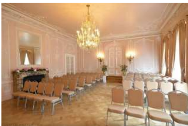
Рис 1.3

Це урочистий зал, який вражає своєю елегантністю та розкішшю.