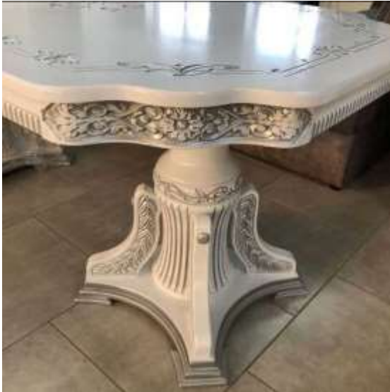
Рис. 3.3 [ https://8mebli.com.ua/ru/katalog/komplekt-stil-ta-stiltsi/komplekt-stil-250kh10050kh2-stiltsi-6-sht-slonova-kistka/ ]

Цей столик вражає своїм унікальним дизайном, який поєднує в собі функціональність та художні елементи.