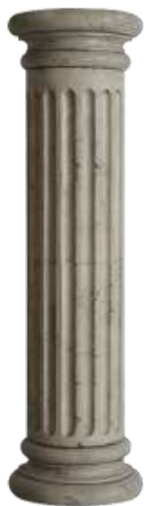
Рис. 3.4 [ https://master-keramika.com.ua/product/fasadnaya-kolonna-1/ ]

Назва: "Фасадна колона №1 з шамотної глини, для дому та саду"