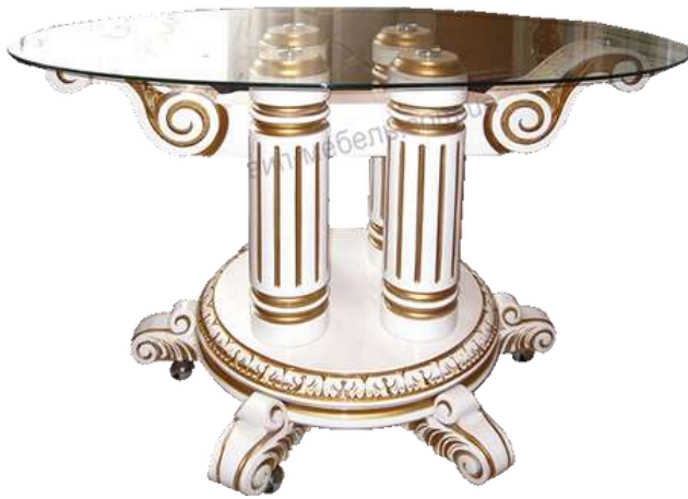
Рис. 3.2 [ https://vip-mebel.net/stol-zhurnalniy-kolonna-2-iz-massiva-dereva-dub/ ]

Цей столик вирізняється своїм бароковим чи рококовим стилем, який характеризується розкішними та декоративними елементами. Овальна стільниця зі скла дозволяє поглянути на основу під нею. Краї скла здаються фацетованими, що додає елегантності столику.