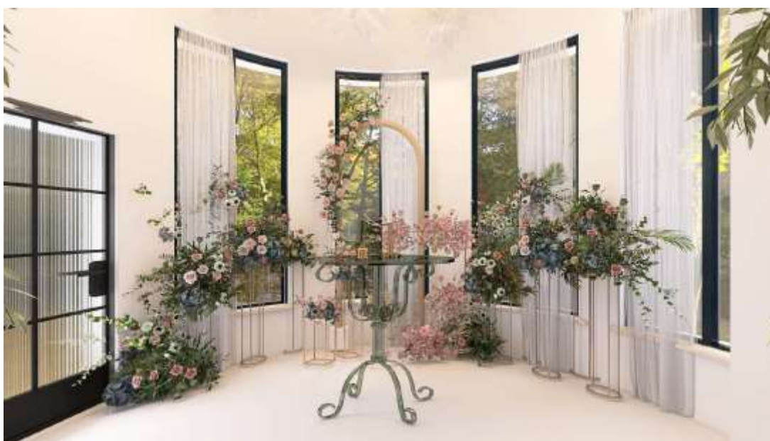
Рис 2.5 Візуалізація зони обручення