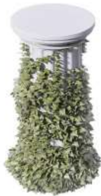
Рис. 3.5 Візуалізація столика

Лазерне різання: Використання лазерного різання для точного вирізання деталей.