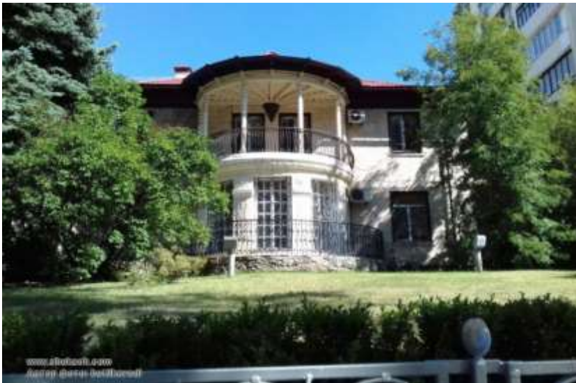
Рис 2.1 Фасад [ https://www.shukach.com/ru/node/57844 ]

Архітектура будинку Ватутіна відповідає стилю радянського неокласицизму, який був характерний для середини 20-го століття. Цей стиль поєднує елементи класичної архітектури з соціалістичними ідеями.