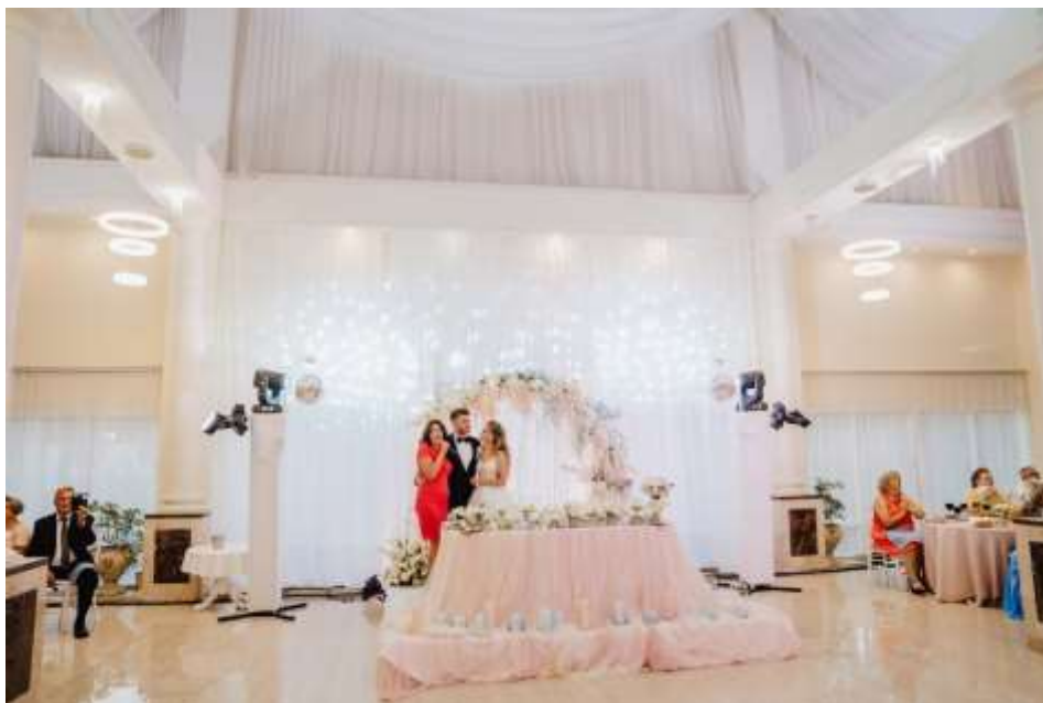
Рис 1.6 [https://www.google.com/search?client=opera-gx&q=Koncha+Zaspa+Park+%26+Resort+by+HeyDay&sourceid=opera&ie=UTF-8&oe=UTF-8#lpg=cid:CgIgAQ%3D%3D,ik:CAoSLEFGMVFpcE5YVIIHekFfS2ZRalMwb1RHd0FweEdJX19WaXV5SkJyR2dCbUj]

Назва: "KNZS Hotel - restaurant Complex Central Park"