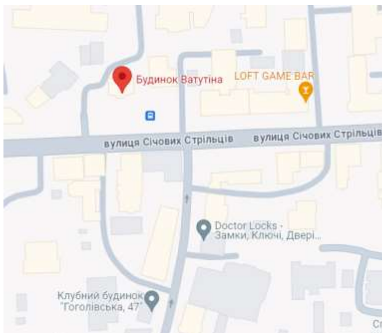
Рис 2.2 Ситуаційний план

[https://www.google.com.ua/maps/place/Особняк+Ватутіна/@50.4564167,30.4926692,17.5z/data=!4m6!3m5!1s0x40d4ce6474320333:0x6ffae6c373fc467e!8m2!3d50.4565444!4d30.4936649!16s%2Fg%2F11dym5djbv?hl=ru&entry=ttu]