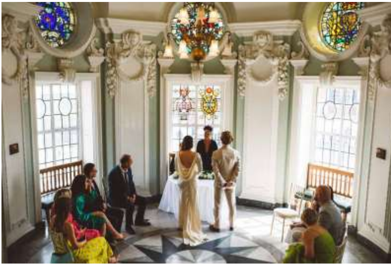
Рис 1.5

Високі стелі зі складними білими ліпними та кольоровими вітражними вікнами створюють теплу та привітну атмосферу. Природне світло, що проникає через ці вікна, створює кольорові візерунки на стінах і підлозі. Невелика група людей присутня у вигляді весільної церемонії, з парою, що стоїть перед вінчальником.