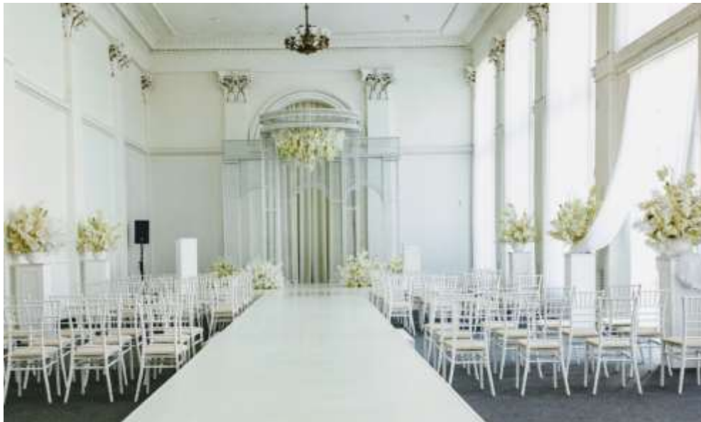
Рис 1.6 [ https://www.zags1.com/ ]

Високі стелі з розкішними ліпнинами та величезний люстра додають простору розкоші. М'які, нейтральні кольори стін гармонійно поєднуються з природним світлом, що проникає через великі вікна з легкими завісами. На дальньому кінці залу розташована витончена квіткова арка, яка стає центральним елементом для церемоній.