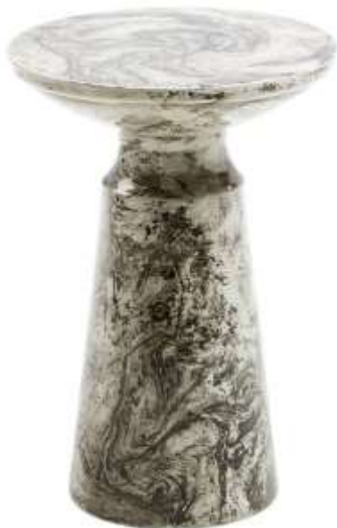
Рис.3.1 [ https://kupistul.ua/kofeyniy-stol-kesbury/935688?gad_source=1&gclid=CjwKCAjwmYCzBhA6EiwAxFwfgJd9cirwOCiBEGMVs0V9j3n2k0ps2R42d7RRX9EOUdnndsKy1L8XihoCC1oQAvD_BwE ]

Назва: "Кофейний стіл KESBURY D33 Чорно-білий"