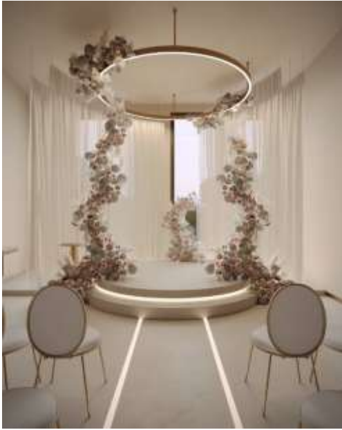
Рис 1.1

Це витончено оформлений простір, який вражає своєю елегантністю. В центрі розташована кругла платформа, над якою висить велика кругла лампа. Платформа та лампа прикрашені квітковими композиціями, переважно в білих та пастельних тонах, які додають квітучості та атмосферу весілля закоханих. По обидва боки від доріжки, що веде до платформи, розташовані сучасні стільці з круглими спинками, вони точно будуть комфортними для рідних та гостей. Підлога підсвічена лінійним освітленням, яке прямує до центральної частини. Кімната має нейтральну колірну палітру: світлі стіни та прозорі штори, що створюють м'яку та спокійну атмосферу.