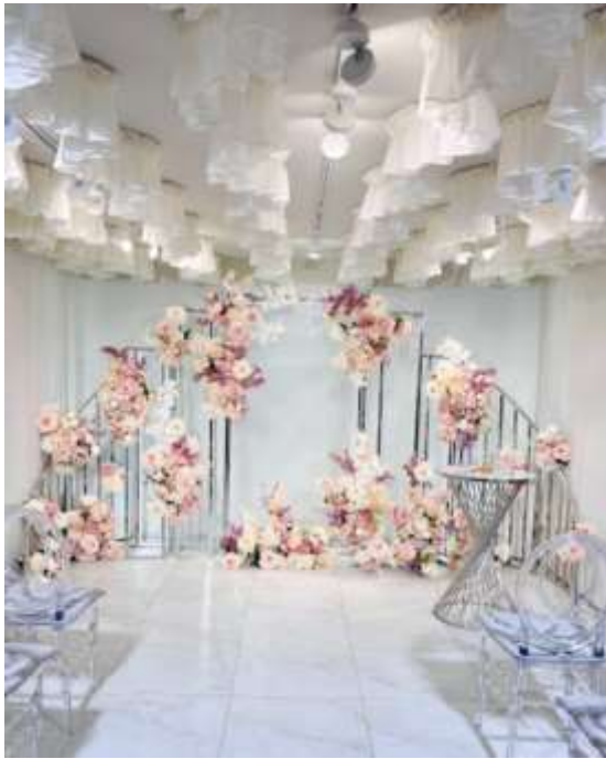
Рис 1.2 [ https://www.instagram.com/p/C40CID5Nl2r/?hl=ru ]