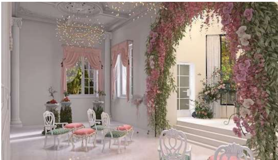
Рис 2.5 Візуалізація зали