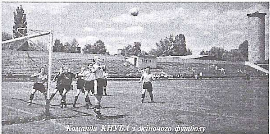
Команда КНУБУ з жіночого футболу