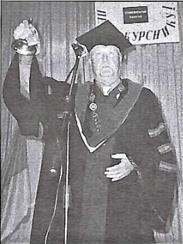
Перший дзвоник в руках ректора запрошує на навчання