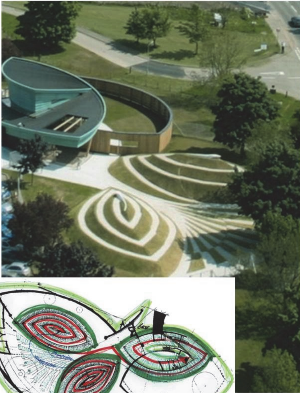
Мал.1 «Меггі-центр» в Единбурзі Чарльз Дженкс , Девід Пейдж.

навколишньої природи, і, в той же час, створюють велику кількість тіней, захищаючи скляні стіни від палючих сонячних променів. Територія будинку ділиться на державні і приватні зони з безшовним з'єднанням і відкритим плануванням.(мал.2)