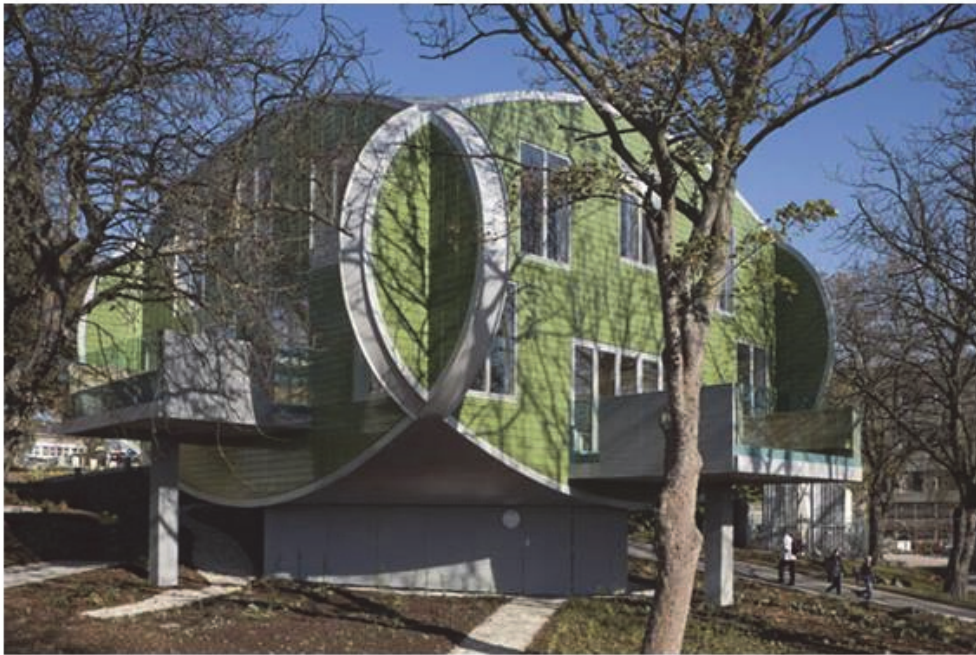
Мал.3 «Меггі-центр в місті Ноттінгем арх. П'єр Гуф.

Сьогодні в світі працює 13 «Меггі-центрів». Всі будівлі з прилеглими парками спроектовані відомими архітекторами. Можливо, що більш уважний аналіз дозволив би розширити і конкретизувати число таких цілющих якостей архітектури. Важливо, ймовірно, і індивідуальне архітектурне рішення, що додає будівлі лікарень неповторний унікальний характер. Однак виникає