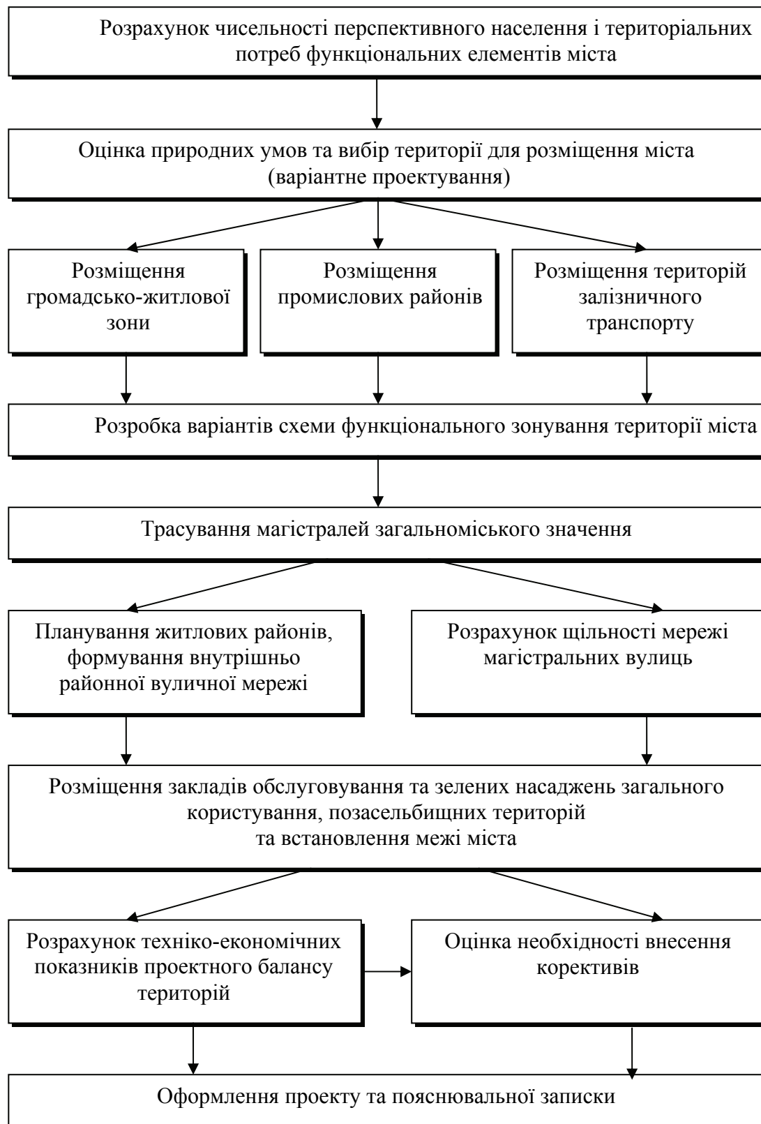
Рис.5. Послідовність виконання курсового проекту

Наступний етап курсового проектування передбачає проведення аналізу і оцінки кліматичних, геоморфологічних, гідрологічних, геологічних умов і