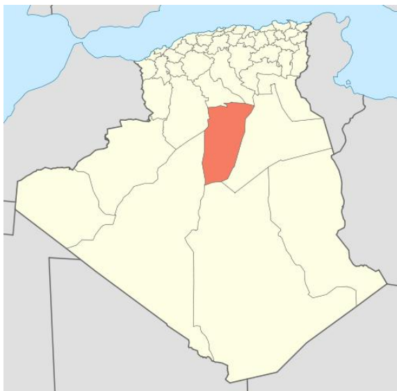
Рис.2. Війлайєт Гардаїя на карті Алжиру.

За іншим принципом розвивались міста хариджитів в долині р. Мзаб (рис.2,3), які виявились найбільш консервативними до містобудівних перетворень і нововведень. На прикладі формування міського простору найбільшого з міст пентаполісу – м. Гардаїя – можна простежити