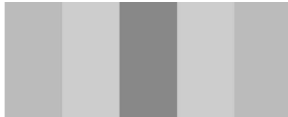
Рис. 2. Поля толерантності

Кожний прямокутник утвореного ряду являє собою «зону толерантності». Перші два сусідні прямокутники об'єднуються у поле толерантності», тобто у таке площинне утворення, яке за сукупною тональною характеристикою істотно відрізняється від прямокутника, який у кілька разів темніший, ніж перші два (рис. 2).