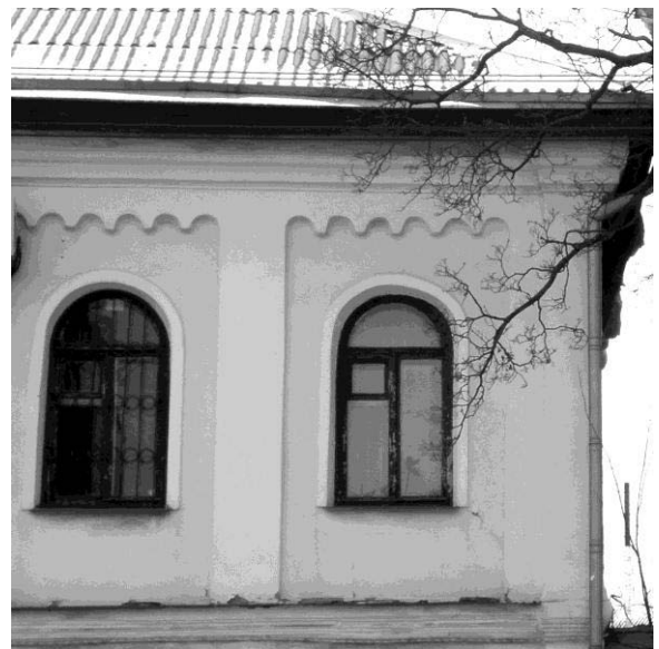
Рис. 5. Фрагмент фасаду будівлі. Формування полів толерантності

На рис. 5 зображений фрагмент фасаду будівлі, на якому видно, що простінок від лівого вікна до білої пілястри, сама пілястра та простінок від пілястри до правого вікна тонально відрізняються на величину порогу тонального розрізнювання і об'єднуються в єдине поле толерантності по відношенню до значно темнішого вікна, як правого, так і лівого. У свою чергу вікна у різних частинах мають тональні відмінності, якими можна знехтувати. Їх зони толерантності об'єднуються в єдині поля толерантності, які визначають їх розмірну структуру. Для аналізу співрозмірності фасаду якраз ширина поля толерантності «простінок – пілястра – простінок» та ширина поля толерантності «вікно» мають прийматися як елементи розмірної структури фасаду. Зорова інформація у їх співвідношенні стане інформаційним кроком інформаційного поля фасаду, який ввійде в систему визначення інформаційних модулів співвідношень елементів розмірної структури фасаду та оцінки сили інформаційного (пропорційного) зв'язку частин архітектурної форми.