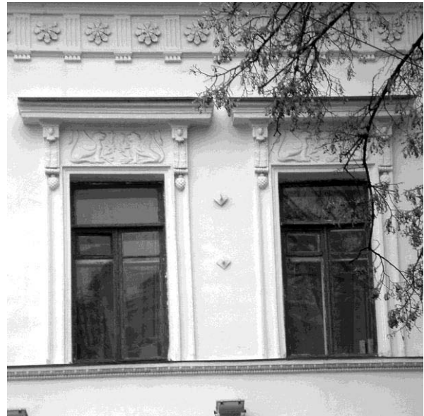
Рис. 7. Фрагмент фасаду будівлі. Поля толерантності фасаду

Висновки. На основі поняття відношення толерантності можна зробити висновок, що частинами архітектурної форми, які повинні братися до уваги при аналізі співрозмірності, є поля толерантності. Вони визначають візуально сприймальну розмірну структуру і формують інформативність архітектурної форми. Відношення толерантності дасть можливість створити алгоритм комп'ютерного аналізу співрозмірності фасадів будівель та гармонізації їх розмірної структури.