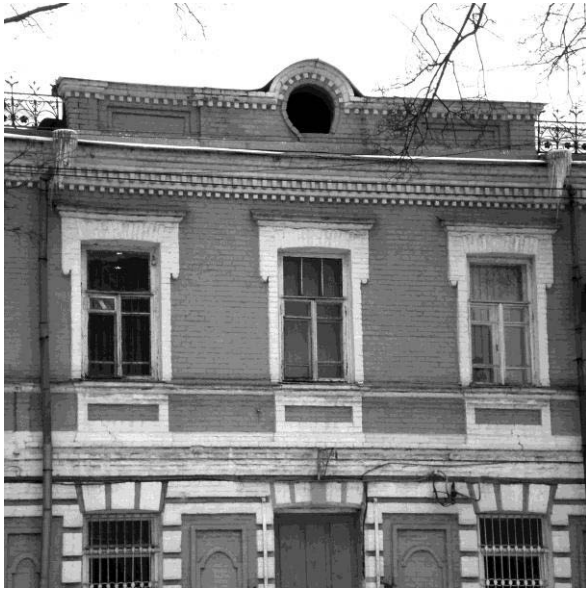
Рис. 6. Фрагмент фасаду будівлі. Формування розмірної структури на основі відношення толерантності

Інший фрагмент фасаду, представлений на рис. 6, дає нам приклад більш чіткого поділу на поля толерантності: вікно та відтинок простінка між білими обрамуваннями (лиштвами) вікон. Якраз розмір вікон між лиштвами та простінку між лиштвами треба брати в розрахунок співрозмірності частин цього фасаду. Листви у цьому випадку виконують функцію розподільчих елементів. Вони відокремлюють поля толерантності та можуть використовуватись для регулювання їх розмірів. А на рис. 7 видно, що листви за тональністю об'єднуються з відтинком простінка між ними в єдине поле толерантності.