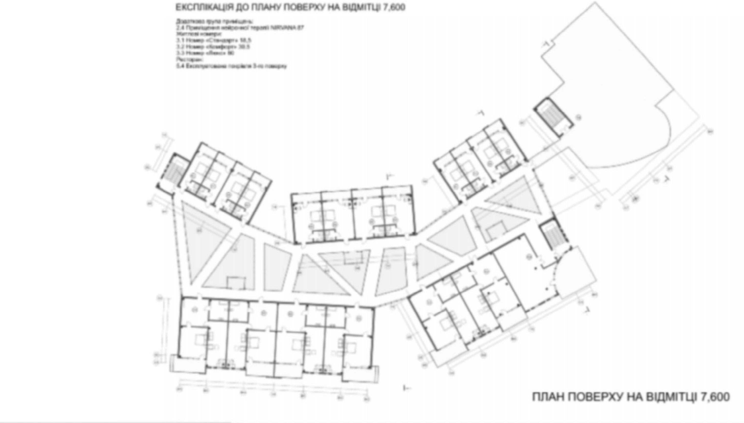
ПЛАН ПОВЕРХУ НА ВІДМІТЦІ 7,600