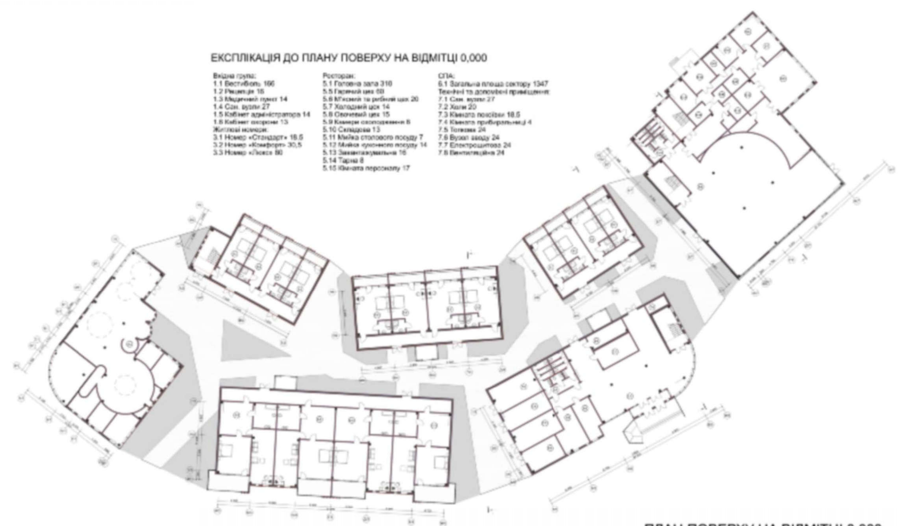
ПЛАН ПОВЕРХУ НА ВІДМІТЦІ 0,000