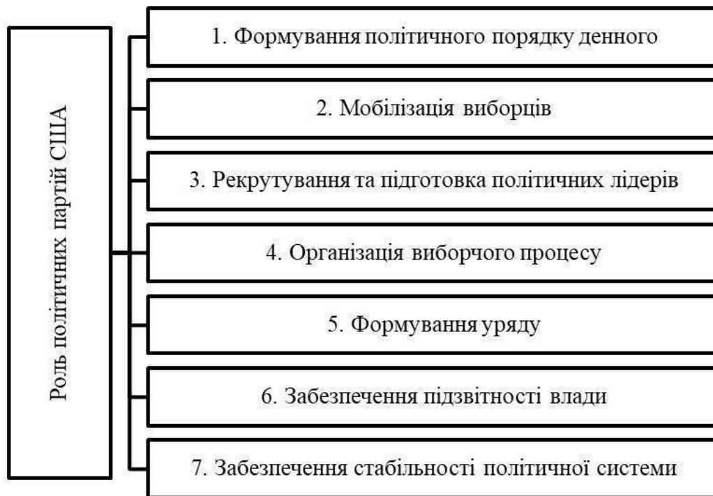
Рис. 1.1. Основні ролі політичних партій в США

Як зауважується сучасними науковцями при формуванні політичного порядку денного партії розробляють і просувають політичні програми, які відображають їхню ідеологію та інтереси виборців [11, с.45]. Вони визначають пріоритети у законодавчій діяльності, такі як економічна політика, права людини, охорона здоров'я, захист навколишнього середовища тощо.