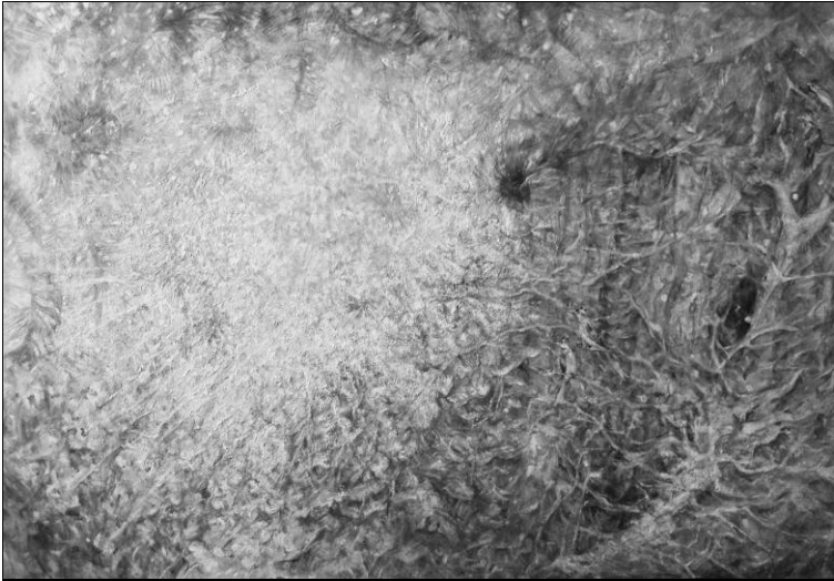
Мал. 5. Пилипчук О. «Тропічний ліс», 2013. Полотно/олія, 110x160 см.