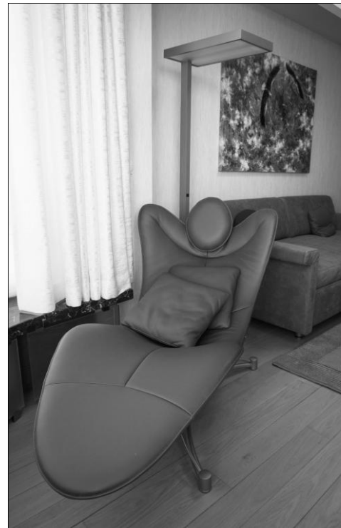
Мал. 4. Інтер'єр кабінету квартири. Реалізація 2013р., м.Київ. Архітектор В.Горовий, художник О.Пилипчук.