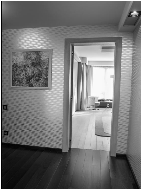
Мал. 3. Коридор в сучасній квартирі. Реалізація 2013р., м. Київ. Архітектор В.Горовий, художник О.Пилипчук.