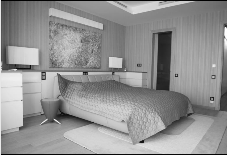
Мал. 1. Інтер'єр спальної кімнати. Реалізація 2013р., м. Київ. Архітектор В.Горовий, художник О.Пилипчук.