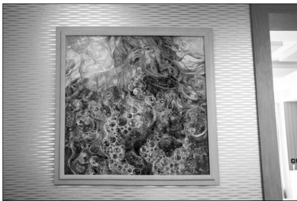
Мал. 7. Пилипчук О. «Народження Венери», 2008. Полотно/олія, 75x70 см