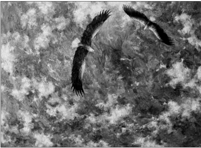
Мал. 6. Пилипчук О. «Політ над Землею», 2013. Полотно/олія, 110x140 см.