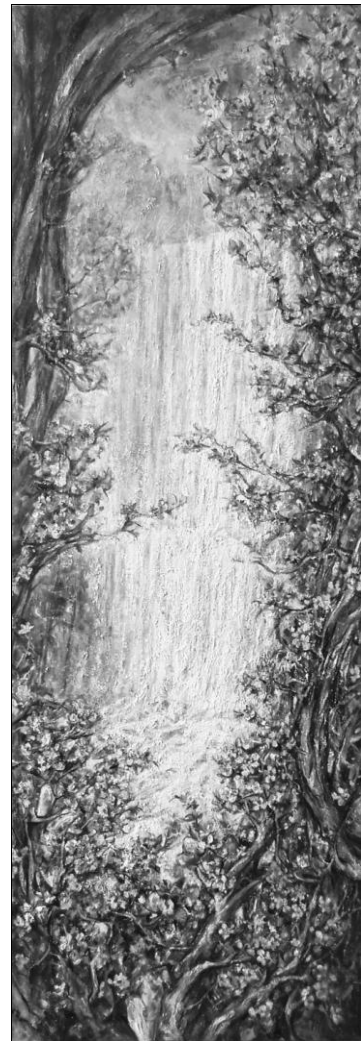
Мал. 8. Пилипчук О. «Водопад», 2013. Полотно/олія, 120/45 см