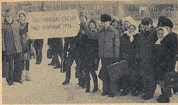
У день відкриття XXV з'їзду Компартії України, на його честь, на будівництві учбових корпусів був організований суботник. Після занять п'ять академічних груп першого курсу санітарно-технічного факультету на чолі з наставниками дружно вийшли на будівельний майданчик учбового корпусу № 1.