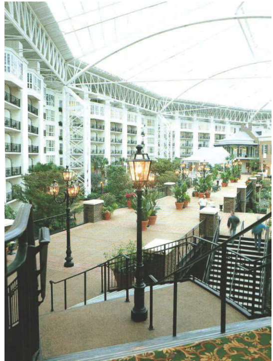
Рис. 3. Малі архітектурні форми в атриумі житлового комплексу

Розглядаючи дану тему, слід зазначити, що з огляду на багатовікову історію розвитку малих архітектурних форм і різноманіття аналогів сучасним дизайнерам іноді буває важко вигадати, створити щось нове, цікаве, варте уваги. У цьому випадку ми пропонуємо робити ставку на функціональності малих архітектурних форм, тобто поєднанні двох різних (навіть протилежних) функцій, а то і трьох – це навіть цікавіше й оригінальніше. Наприклад, поєднання в одному об'єкті фонтану і дитячої гірки, фонтану і алеї для відпочинку, лави і квітника, лав і дошок оголошень; приклад трьох функцій – квітник, лава, бювет або інший – лава, ліхтар, урна, або – колона, ліхтар, лава. Зрозуміло, що у створенні таких малих архітектурних форм не останнє місце будуть займати і нові технології, тобто можливості об'єднання різних функцій, їх доцільності, вивчення питання ергономічності нових об'єктів, розгляд і