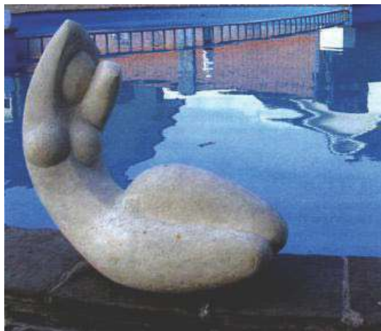
Рис. 2. Декоративна скульптура біля басейну у вестибюлі

Саме цим пояснюється велике поширення в сучасних ансамблях та інтер'єрах самотійних просторових композицій із малих архітектурних форм (предметний інтер'єр), ніби не пов'язаних з архітектурною основою, але такими, що формують потрібні людині «міні-простори», ізольовані куточки, оздоблення яких має своє обличчя, яке відповідає їхньому призначенню й утворене даним комплексом малих архітектурних форм. Так, на сьогоднішній день малі архітектурні форми завдяки нетрадиційним технологіям і фантазії дизайнерів може виступати цілком самотійним об'єктом у середовищному дизайні.