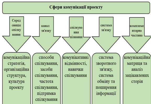
Рисунок 1. П'ять основних напрямків комунікаційного менеджменту проекту

План комунікації проекту є цінним інструментом, який може допомогти керівникам проєктів і командам оптимізувати та координувати свої зусилля, гарантуючи, що всі працюють на одній сторінці. [5]