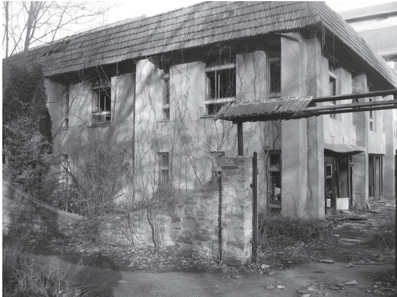
Фото. 2. Руїни санаторію «Медобори»

влади та місцевого самоврядування бережно ставитися та дотримуватися чинників просторового розвитку, містобудівної документації, а також прийнятих планувальних рішень.