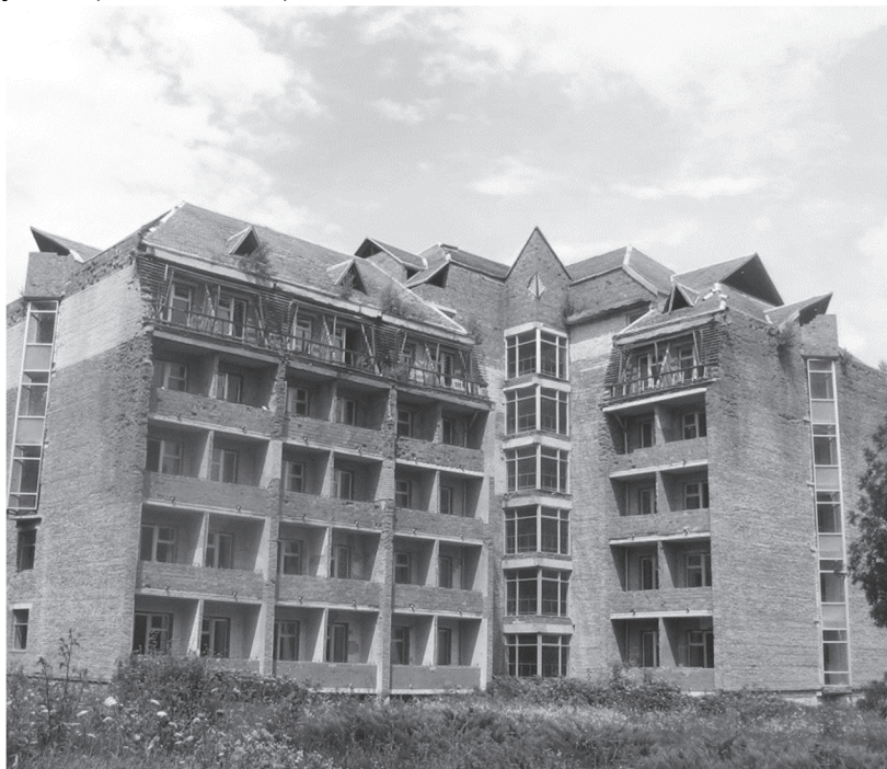
Фото. 1. Руїни недобудованого корпусу санаторію «Збруч»

року) є те, що призвело до припинення практичної діяльності санаторіїв “Медобори” у 1998 році та “Збруч” у 2010 році. На сьогодні вони перетворилися на руїни (Фото.1,2,3).