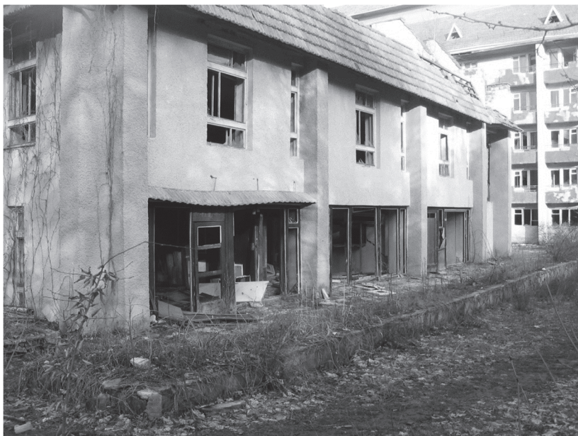
Фото. 3. Руїни санаторію «Медобори»

Так, правила функціонального використання територій, які були встановлені у генеральних планах селища, керівництвом місцевого самоврядування та районної державної виконавчої влади, принципово порушені. В наслідок чого набула широкого розповсюдження ситуація безконтрольного розкрадання територіальних ресурсів. Це призвело і продовжує призводити до руйнування передбаченої генпланом функціонально – територіальної структури населеного пункту. Процес розроблення та реалізації генплану кожного