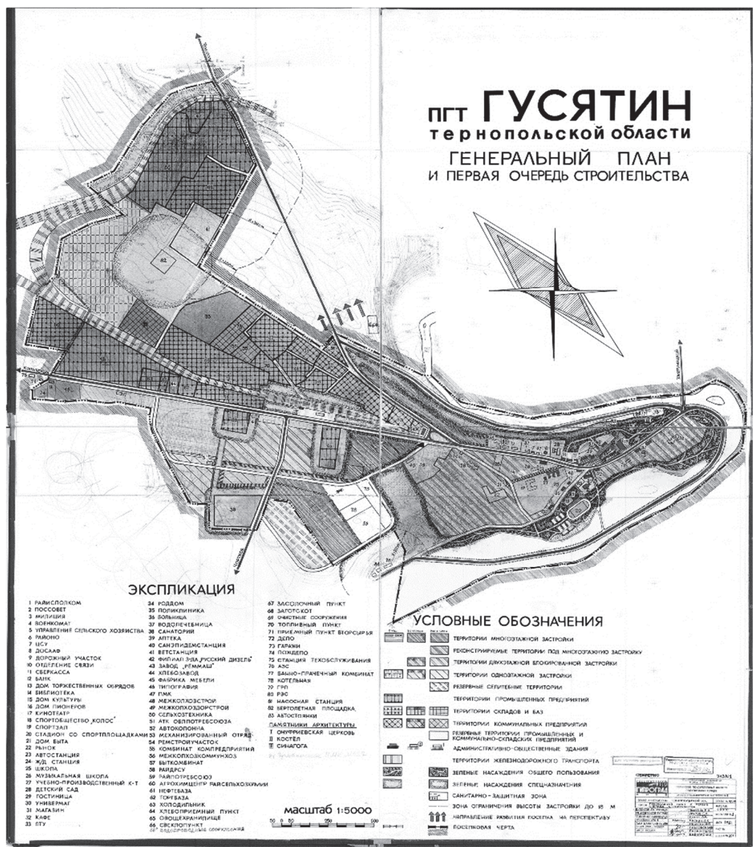
Рис. 2. Генеральный план снт Гусятин 1981 року

пов'язаних з використанням рекреаційного потенціалу та розвитку селища як регіонального курорту.