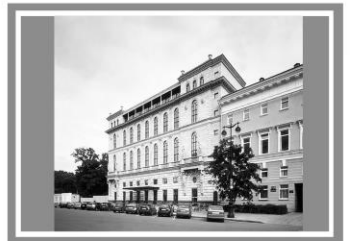
Готель «Островський», Росія, Санкт-Петербург