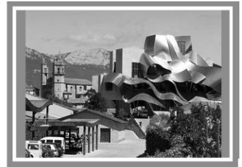
Готель «Маркес де Ріскаль», Іспанія