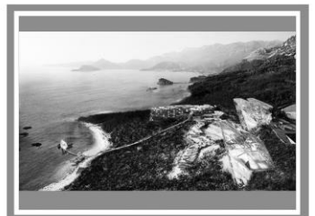
Готель «Монтенегро», Чорногорія