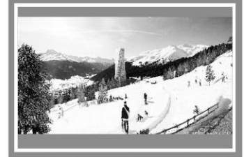
Готель «Шнабель-Тауер», Швейцарія, Давос