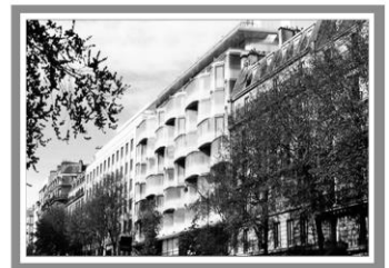
Готель «Ренесанс», Франція, Париж