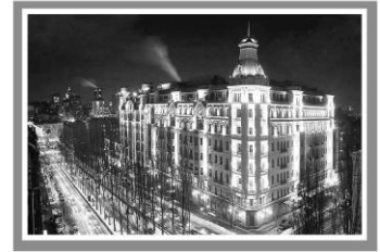
Готель «Прем'єр-Палас», Україна, Київ