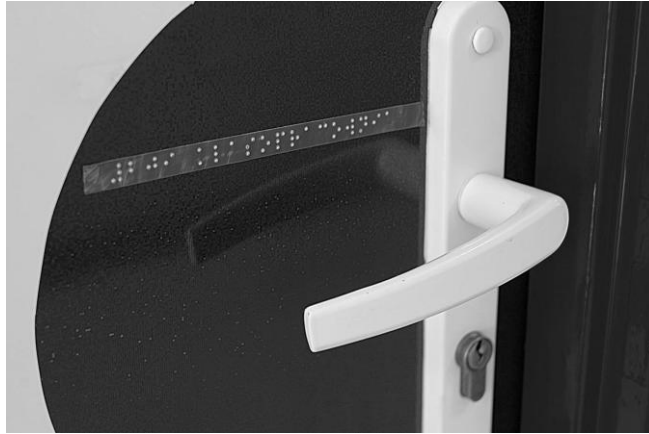
Дверная ручка с надписью шрифтом Брайля