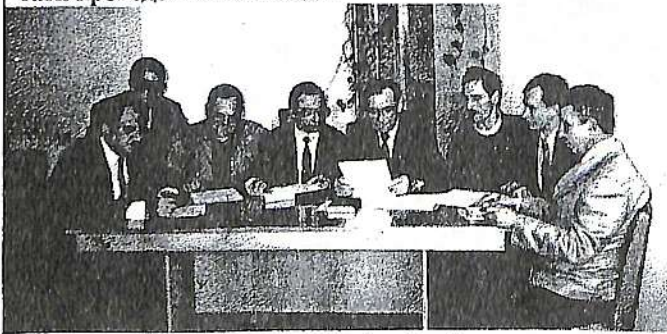
Засідання жюрі олімпіади

Наступного дня були офіційно оголошені результати проведення олімпіади.