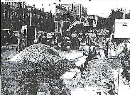
Хрещатик під час реконструкції

- Так, практика для будівельника необхідна. І попри все користь від неї є. Головне, що я відчув, – розбіжність між теорією й практикою.