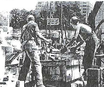
Працюють студенти 27 групи

- Але це рівень управління, ділянок, бригад, нарешті. А от чи відображається це на окремих робітниках?