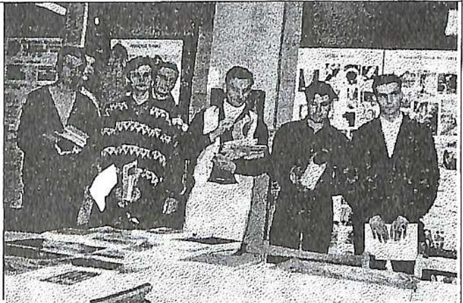
Переможці студентської олімпіади

Хотілося б зупинитися на завданнях, які були запропоновані на олімпіадних змаганнях. Треба відзначити, що їх число і тематичне спрямування були значно розширені порівняно із минулими роками. В завдання були введені текстові питання та питання, що стосуються новітніх досягнень кращих зразків будівельних машин відомих вітчизняних і зарубіжних фірм та корпорацій. Конкурсні завдання були умовно поділені на 3 групи: підйомно-транспортні, землерийні та будівельні машини. Таким чином завдання охоплювали всі основні дисципліни, що вивчаються за даною спеціальністю. Кожне завдання складалося з 11 питань та прикладу виконання збирального креслення.