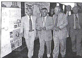
Київський мер під час візитування своєї Альма-Матер. 1.07.2004 р.

Ніколи не забував привітати з професійним святом педагогів своєї Альма-Матер і Київський міський голова Олександр Александрович ОМЕЛЬЧЕНКО. Осє слова його вітання.