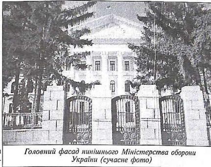
Головний фасад нинішнього Міністерства оборони України (сучасне фото)

Навчальними закладами першого рівня були кадетські корпуси. Генерал А. Ігнатьєв так описував становлення корпусів у Росії: "У країні було близько 20 кадетських корпусів... Найдавнішим був І-й Петербурзький кадетський корпус, заснований ще під час правління Анни Іоаннівни під іменем Сухоплутного шляхетського, за зразком пруського кадетського корпусу Фрідріха І. Задум був такий: віддалити дворянських дітей від розкладаючого сибаритського сімейного середовища і замкнувши їх у спеціальну військову казарму, підготувати з малих літ до перенесення праці і злиднів військового часу, виховувати перш за все почуття відданості престолу і таким чином створити з вищого стану першокласні офіцерські кадри. Це було на смак Миколі І, який розширив сіть корпусів і, між іншим, побудував прекрасну будівлю Київського корпусу. В епоху Олександра ІІ кадетські корпуси були перейменовані в військові гімназії, але в 80-ті роки Олександр ІІІ повернув їм їх вівідну назву і форму.