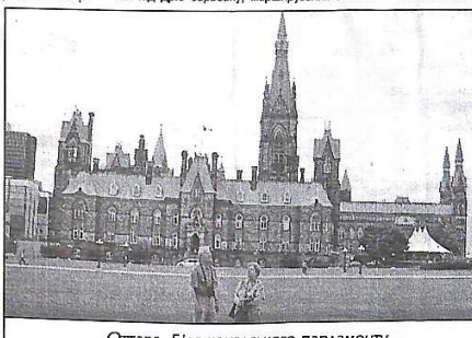
Оттава. Біля канадського парламенту

нанням різних вправ, тощо). В один з моментів пролунав гарматний постріл. У військову форму старих часів одягнули не тільки хлопці, але й дівчата, вони й виконують це шоу.