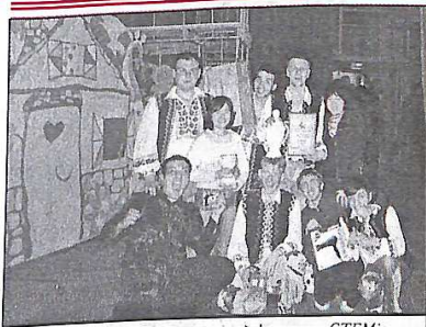
Заторіжжя. VI Міжнародний фестиваль СТЕМів "Студентська жартів – 2004". "Дивні люди" став тотої лауреатом I ступеню.