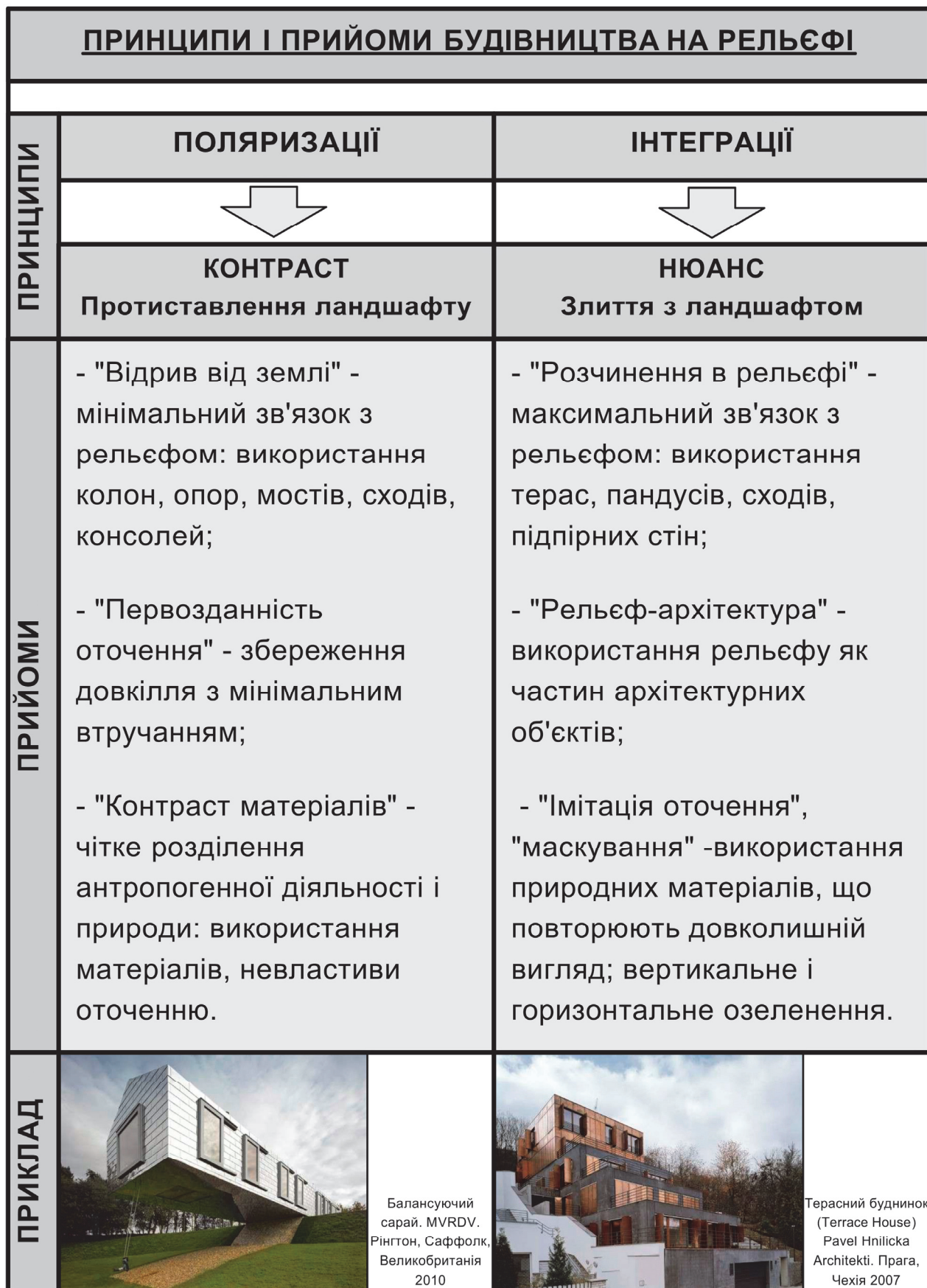
Рис. 1. Принципи і прийоми будівництва на рельєфі