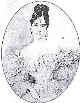
К. Брюлов "Портрет Наталі Пушкіної"

4. Відносно подарунків. Мабуть, прийшли ті добрі часи, про які співався "Не могу я тебе в день рождения дорогие подарки дарить, но могу в эти ночи весенние я тебе о любви говорить". Кохання це добре, але, як висловлюються сучасні жінки, його треба ще чимсь підігрівати. Нормальні чоловіки це розуміють і, даруючи жінці, самі отримують задоволення. Як правило, підчас зустрічі з жінкою найчастіше потрібно дарувати квіти (бажано, які вона любить!). Якщо зустріч пов'язана з днем народження і іншими відомими святами,