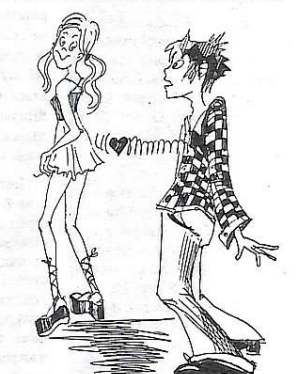
Рис. М. Сивашової

— Так, для того, щоб було кому берегти жінок. (Алла В.) — Ні! Чим більше ми їх бережемо, тим більше вони стають безпорадними. (Інна С.) — Берегти необхідно, особливо професорсько-викладацький склад. (Оля К.)