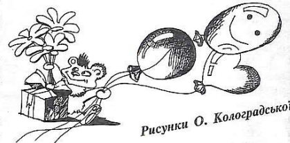
Рисунки О. Колоградської