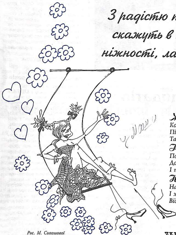
Рис. М. Сивашової