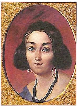
Т. Шевченко. Портрет Ганни Захревської. Олія

Спочатку вабила його акварель. Серед портретів, створених Шевченком у цей період, є портрети погрудні, поясні, на цілий зріст, а також портрети, які стоять на межі портретного та побутового жанрів. У цих творах простежується прагнення митця підкреслити гармонійну сутність людини. Для Шевченка людина – міра всіх речей, він бачить і виявляє у ній прекрасне й високе. Жодна тінь душевного неспокою, здається, не затмарює обличчя портретованих. Часто це його знайомі, приятелі, лагідні, шляхетно відгнені жінки. Образи ці оповиті своєрідним романтичним серпанком. І це не дивно: в європейському мистецтві настала епоха романтизму. Під впливом