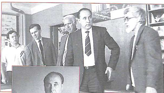
На архітектурному гаряча пора – підготовка до захисту дипломних проектів