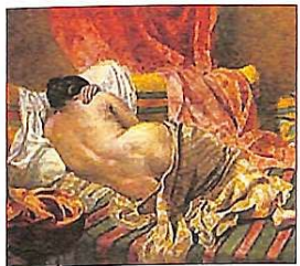
Одалістка. 1840 р.

У Петербурзькій академії мистецтв Шевченко добре опанував техніку олійного живопису. 1840 року він був нагороджений медаллю другого ступеня за