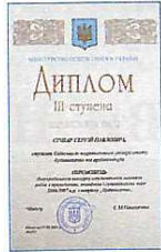
Диплом III ступеня – студенту С. Січкару