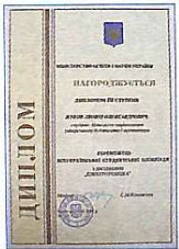
Диплом III ступеня – студенту Л. Жукову