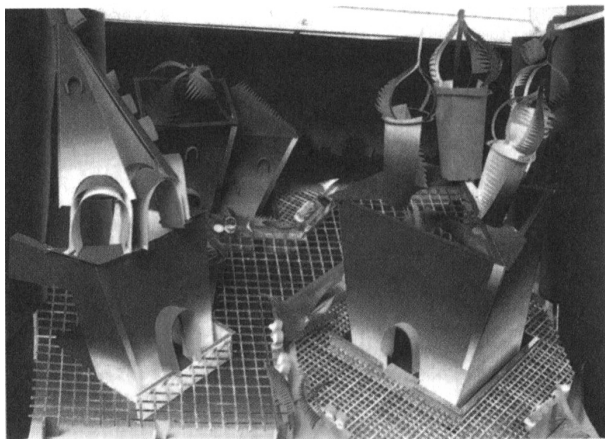
Рис. 3. Роботи Сенежської студії художньо-проектної творчості під художнім керівництвом Євгенія Розенблюма:

а). проект оформлення району Зарядде в Москві до Олімпіади-80, 1979 рік;