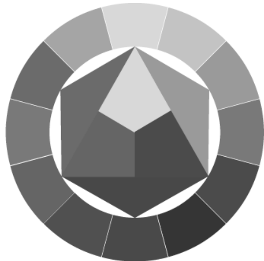
Рис. 2. Художнє проектування в Баухаузі: а). Йоханнес Іттен проводить заняття. 1954 рік; б). Колористичне коло І. Іттена. 1961 рік.