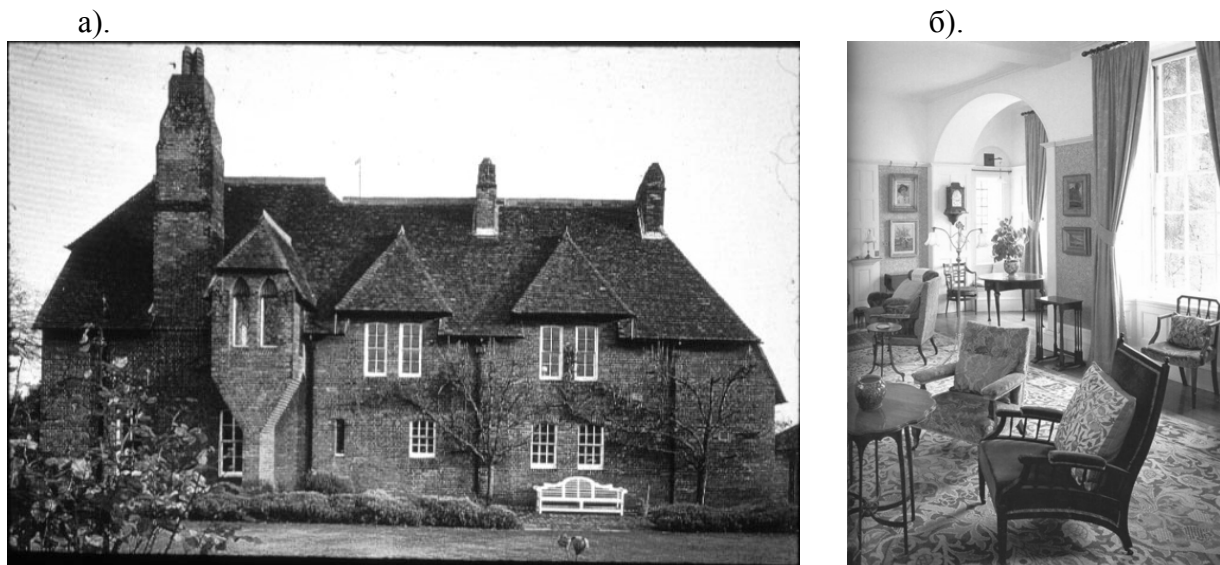
Рис. 1. Червоний будинок (RedHouse) в м. Бекслі-Хіс для родини, 1860 рр. Арх. Ф. Вебб, У. Морріс : а). Зовнішній вигляд, фото; б). Вітальня, дизайн інтер'єру, фото.

зовнішні цегляні стени будинку не були вкриті тинкуванням. Над оформленням інтер'єрів працювали Берн-Джонс, Россетті, Елізабет Сіддал та сам Морріс з дружиною (Рис. 1).