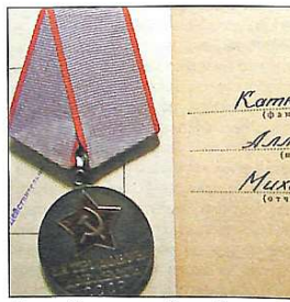
Медаль «За трудову доблесть»

Школу трудових семестрів пройшли будагонівці КНУБА. Їх робота та відмінне навчання було оцінено країною.