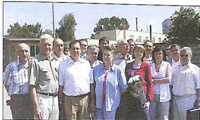
Члени комісії у СПМК-2 тресту "Теплицьтехмонтаж"