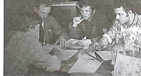
Штаб студентського будівельного загону леді! важкі місцеві підлітки.