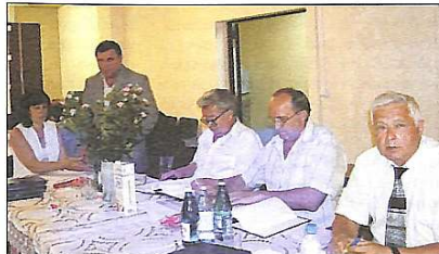
Працює II-га Державна екзаменаційна комісія КНУБА