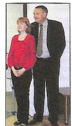
Батьківська доля – переживати за дітей