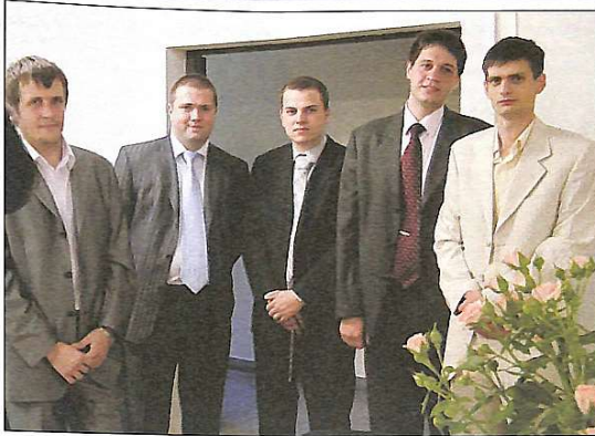
Дипломники перед захистом