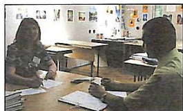
До зовнішнього незалежного тестування ставлення в суспільстві