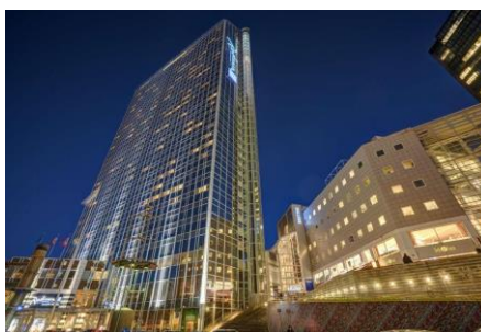
Рис.3.3 Radisson Blu Plaza Hotel, Осло

Цей готель є однією з архітектурних домінант столиці Норвегії та ідеальним вибором для тих, хто хоче поєднати міський комфорт з можливістю дослідження природи.