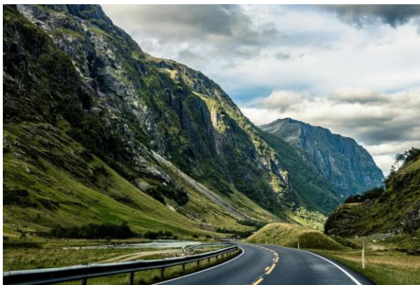
Рис.2.2 Національний парк Брехеймен

Засніжені гори змінюються лісовими долинами. Серед цих мальовничих пейзажів заховані крижані холодні річки та глибокі озера. У цих місцях добре розвинені походи, катання на лижах та альпінізм.