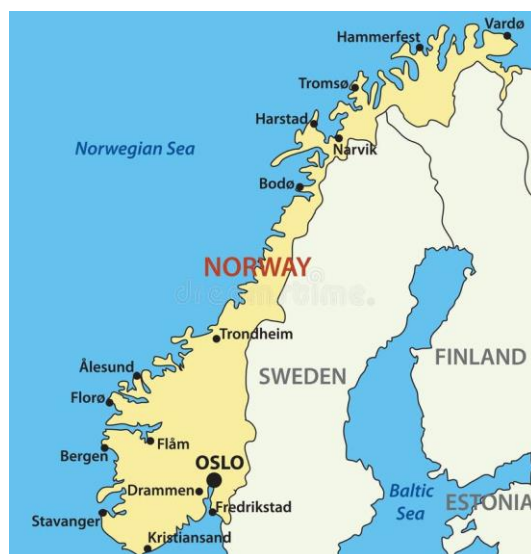
Рис.2 1 Норвегія на карті

Територія країни витягнута у вигляді вузької смуги вздовж північно-західного узбережжя Скандинавського півострова з південного заходу на північний схід. Найбільша ширина країни 430 км, найменша (в районі Нарвіка) – близько 7 км. Протяжність країни з півночі на південь - 1700 км.