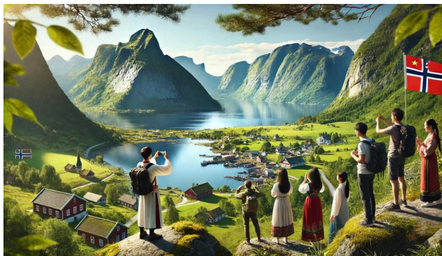
Рис.1.1 Екотуризм у Норвегії

Ідея мексиканця прижилася, і вже 1990 року з'явилося Міжнародне товариство екотуризму. У ньому розробили основні правила та критерії екологічної подорожі, які є актуальними до цього дня.