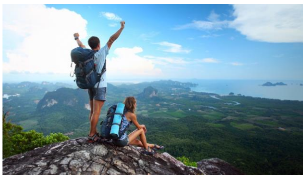
Рис.1.3 Спортивний туризм

Дуже часто показ природних об'єктів, особливо в печерах, супроводжується кольоровим підсвічуванням, музикою, театралізованими виставами, що демонструють сцени з життя аборигенів.