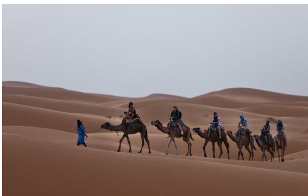
Рис.1.2 Приклад пригодницького туризму

Спортивний туризм як подорожі з метою заняття спортом або відвідування змагань включає і види туризму, не пов'язані з пригодами та ризиком.