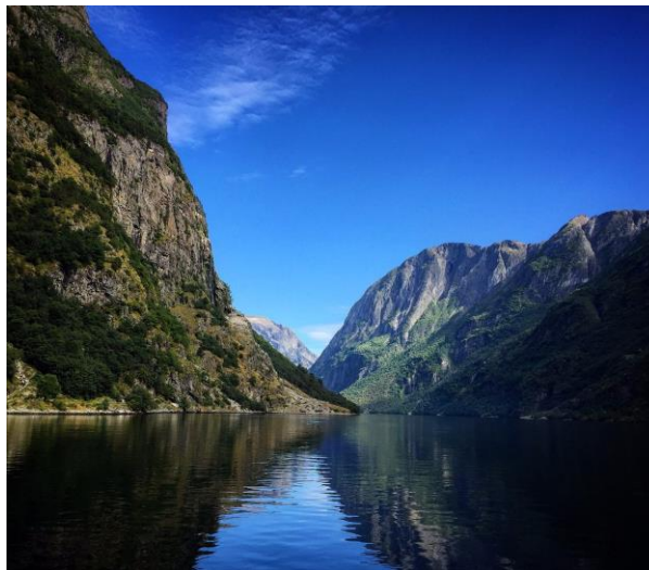
Рис.2.5 Согнефіорд (Sognefjorden)

Тут же розташовані найстаріші із 28 унікальних дерев'яних церков Норвегії.