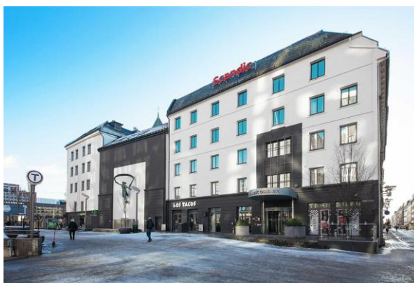
Рис.3.4 Scandic Gardermoen(Осло)

Розташований лише за 10 хвилин їзди від аеропорту Осло-Гардермоен, цей готель ідеально підходить для мандрівників, які прибувають пізно ввечері або мають ранній виліт. Вартість проживання варіюється від £93 за ніч.