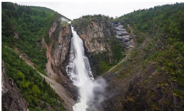
Рис.2.3 Національний парк Довреф'єлль-Сунндалсф'єлла

Найбільш високою вершиною парку є гора Снехетте, яка вражає своєю величчю.