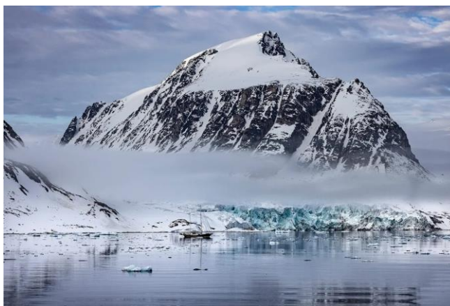
Рис.2.4 Національний парк Сор-Шпіцберген