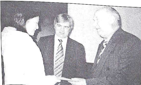
Дипломи з відзнакою в руках українських студентів