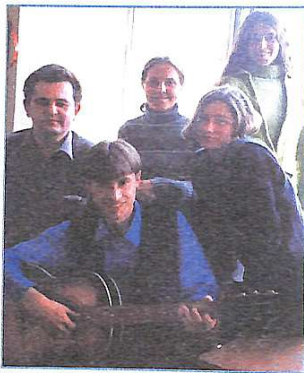
Аспіранти, студенти, випускники архітектурного факультету разом з редактором "А+Б"