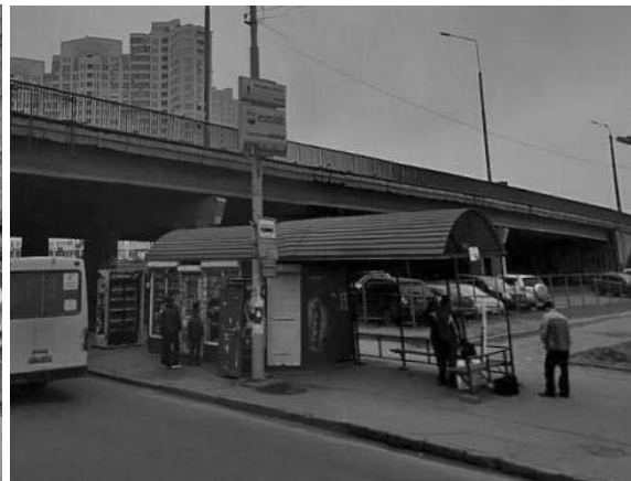
Рис.3. Зупинка громадського транспорту «Осокорки».

На основі натурних обстежень, проведених під час паспортизації вулиць м. Київ, мною було запропоновано методику аналізу архітектурного середовища громадсько - транспортного вузла, де по горизонталі було представлено ряд характеристик з технічних, нормативних, естетичним, візуальним критеріями, а по вертикалі відповідно певний громадсько - транспортний вузол міста. Дана методика дала право сформулювати ряд структурних елементів архітектурного середовища громадсько - транспортного вузла: