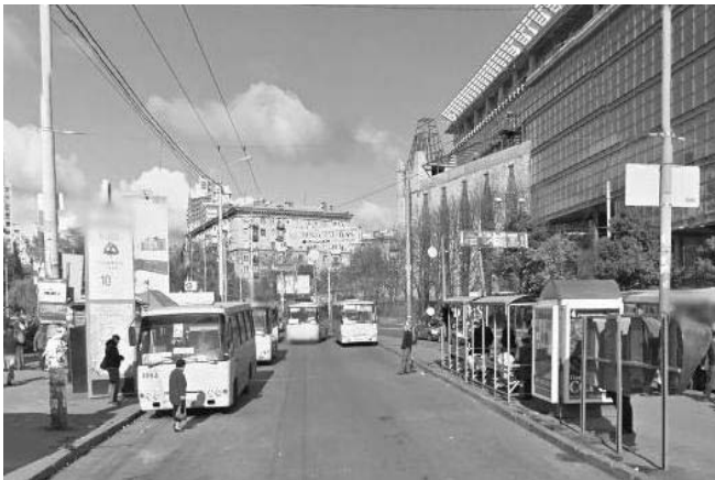
Рис.2. Зупинка громадського транспорту «Лук'янівська».