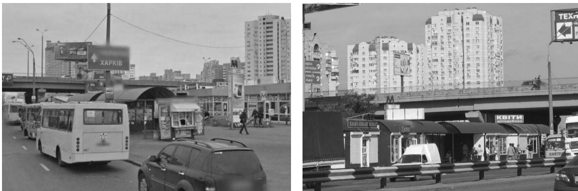
Рис. 1. Громадсько-транспортний вузол станція метро «Позняки».

Громадсько-транспортний вузол, досить нове поняття в архітектурі, це поєднання горизонтальних потоків громадського транспорту та вертикальних комунікацій (ліфтів, ескалаторів, сходів) з рядом функцій: громадських, комунальних, ділових, побутових, господарських центрів різної функціональної насиченості (рис. 1).