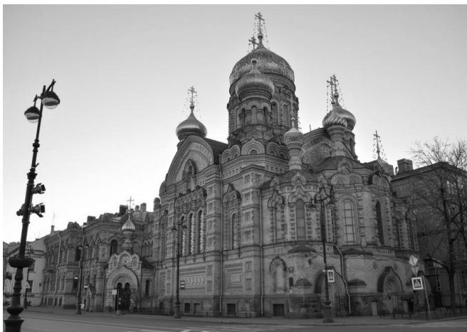
Мал. 7. Храм Успіння Пресвятої Богородиці

обійстя було побудовано заново - з тим храмом Успіння Пресвятої Богородиці (мал.8.), який зберігся до наших днів.