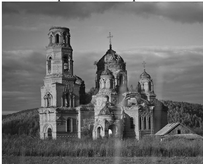
Мал. 4. Храм Різдва Христового, с. Городище, Ульяновська обл.

В архівних справах Полтавської духовної консисторії в реєстрі проектів храмів проект Свято-Успенського собору не значиться. Скоріше всього, що він будувався за типовим проектом. Про це говорять і інші культові споруди, розміщені в різних місцях і схожі за своїм зовнішнім і внутрішнім виглядом на Золотоніський храм. Зокрема спеціалісти в області архітектури відзначають схожість з церквою Різдва Христового в Городищах.