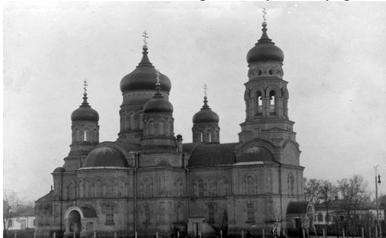
Мал. 3. Успенський собор. Фото 1909 року.

Гетьманщини – Чигирин, у своїх спогадах за 1656 рік пише: «Потім ми проїхали ще 4 милі і прибули в містечко, подібне першому по імені Золотоноша з двома церквами із яких одна в честь Успіння владичиці». Про більш раннє існування храмів писав у своїй роботі «Місто Золотоноша та його святі храми». Зокрема він відзначав: «Але і цю будівлю храму зведено було на місці ще давнішого; мабуть, і остання не була найпершою, бо в перші роки XVII ст. Успенська церква з Микільською вже були осередком добре організованого релігійного життя». Ці два храми, розташовані в центрі міста, надійно захищені стінами фортеці, земляними валами, воротами з підйомними мостами, слугували задоволенню релігійних потреб містян. Між ними знаходилась сотенна управа, ближче до Успенської церкви – духовне управління.