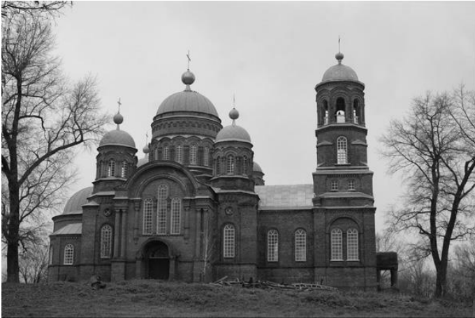
Мал. 5. Покровська церква, с. Антонівка. Чернігівська обл.