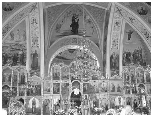
Мал. 2. Інтер'єр собору. Фото 2019 року.

Історія Золотоніського храму (мал. 1.) почалася ще в далекому 1745 році. Тоді на місці, де височить сьогоднішня цегляна споруда, за настоятеля Василя Петрашевича (“як говорять про те різні написи на дверях”, - писав у своїх спогадах М. Максимович) козаком з містечка Домонтове був збудований дерев'яний храм Успіня Пресвятої Богородиці.