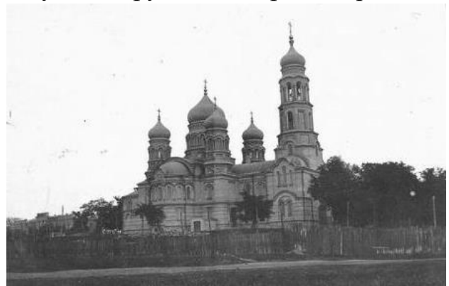
Мал. 7. Троїцький собор, м. Кременчук, Полтавська обл. Фото 1915 року.

Новий, кам'яний собор був освячений 23 серпня 1915. Майже за два місяці до цього, 27 червня 1915 року відбулося урочисте освячення і підняття хрестів над цим храмом.