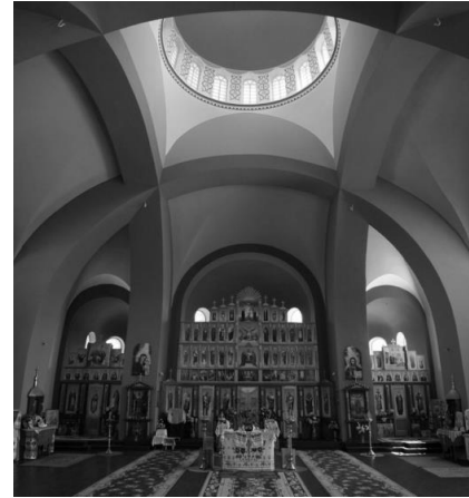
Мал. 6. Інтер'єр церкви.

Церква унікальна ще й оформленням інтер'єру. Величезний об'єм пофарбований у синій, жовті, червоні та (інколи) білі кольори. Найбільше навантаження покладене на синій та жовтий. А ще вона унікальна тим, що немає жодної колони - громадина храму тримається виключно на арках.