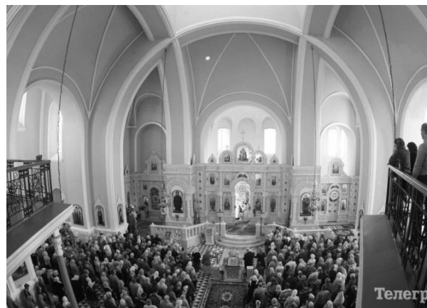
Мал. 10. Інтер'р собору.

Головними особливостями, які об'єднують вищезгадані храми є: хрестово-купольний тип храму з конструктивною аочно-стійковою системою в основі будови. Підпружні арки, що спираються на зовнішні стіни з виступаючими пілястрами, служать основою для циліндричних склепінь, що становлять хрест з кутовими осередками. Головний світловий барабан, що стоїть на центральних