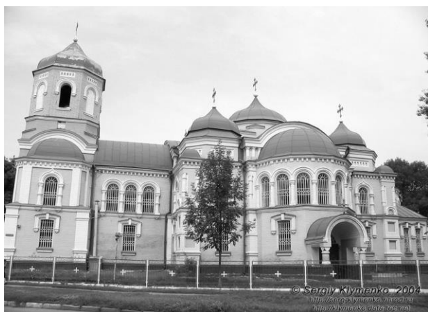
Мал. 1. Успенський собор, м. Золотоноша. Фото 2019 року.

Ключові слова: м. Золотоноша, Успенський собор, церква Різдва Христового в Городищах, Покровська церква у селі Антонівка, Троїцька церква, Подвір'я Введенського ставропігійного чоловічого монастиря Оптина пустинь, Собор Різдва Богородиці в Козельщині, вівтар, російсько-візантійський стиль, купол, баня, арочно-стійкова система, апсида.