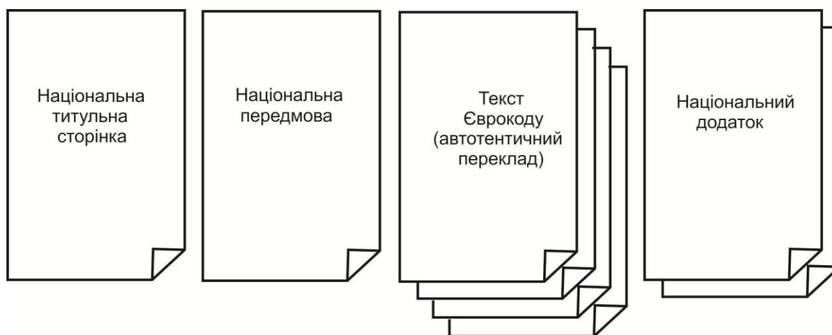
Рис. 2. Структура національного стандарту, що імплементує Єврокод

Як уже вище зазначалось, Порядок механізму дії національних стандартів, гармонізованих з Єврокодами, визначено у постанові Кабінету Міністрів України від 23 травня 2011 р. № 547.