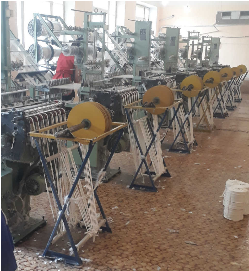
Рис.1. Ткацькі верстати цеху бавовняних виробів до заміни обладнання

Більшість технологічних процесів, що відбуваються у цеху бавовняних виробів і на аналогічному виробництві супроводжуються інтенсивним виділенням пилу різних розмірів, що сильно забруднює виробниче середовище, а також технологічне обладнання, ускладнює протікання технологічних процесів і значно погіршує умови роботи технологічного обладнання, а також умови перебування людини в такому середовищі. Існує прямий зв'язок між інтенсивністю роботи обладнання, виробництвом бавовняних виробів та кількістю виділення пилу. Зазвичай при проектуванні нової системи аспірації повітря або при реконструкції існуючої системи для вентиляційного та пилоочисного обладнання відводяться значні виробничі площі, що ускладнює роботу цеху при невеликих його площах. Але найважливішим є забезпечення безпеки перебування людини у виробничому середовищі [2, 5].