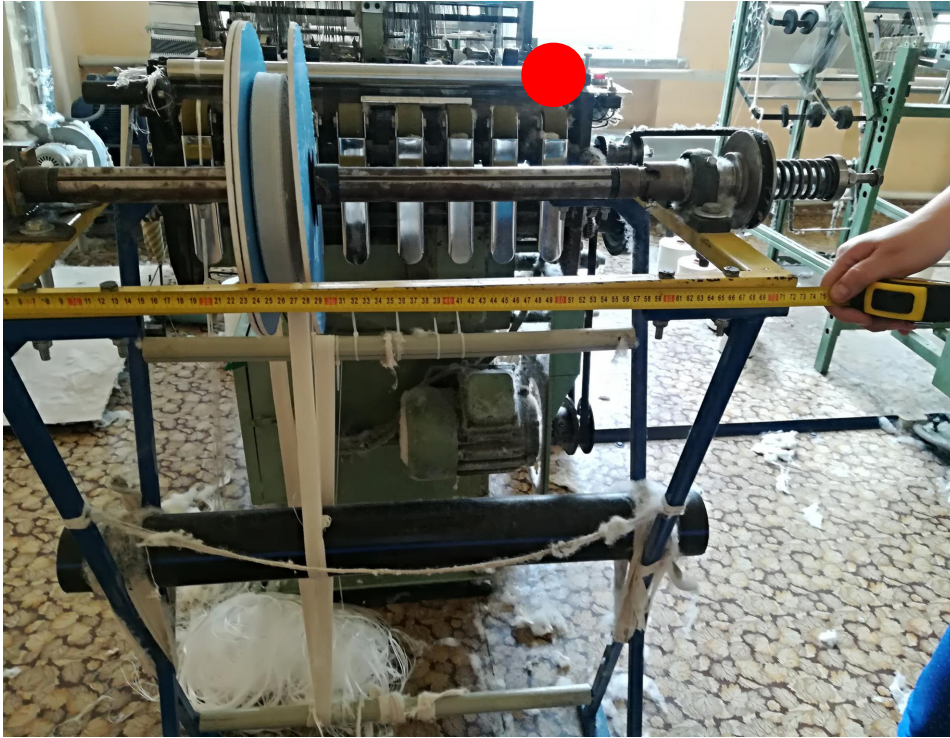
Рис. 3. Ткацький верстат цеху бавовняних виробів