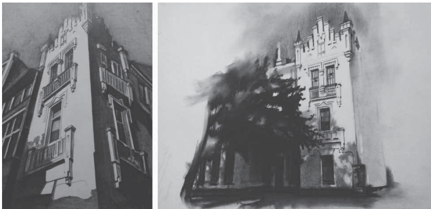
Рис. 2 Житловий будинок по вул. Пушкіна, 40

Для Полтави, як це не дивно звучить, модерн не став тим домінуючим стилем, яким він став для Львова, Києва, Харкова, оскільки два навіть унікальних об'єкти українського модерну не визначають стилістичну забудову кварталів в цілому. Натомість значно сильніше в Полтаві звучала тема козацького «гранчастого» бароко в численних культових спорудах, а з ХІХ століття – тема імперського класицизму-ампіру дуже високого стилістичного рівня (проектуванням займалися кращі архітектори Петербурга і Москви) [2]. Версія же інших (крім українського) різновидів модерну в Полтаві – характерний варіант якісного «провінційного» модерну місцевих підрядників, домовласників-лікарів та підприємців, для якого якраз і притаманний сильно виражений регіоналізм у вигляді нашарування інших стилів. Поряд з цими будівлями стоїть і цікавий приклад псевдоготики, який теж вплинув на формування стилістичних особливостей модерну Полтави – будинок на вул. Пушкіна, 40, який є зменшеною варіацією англійської псевдоготики II пол. ХІХ ст., спорідненою з відомими київським «Замком Річарда» на Андріївському узвозі. Поряд із українським модерном в Полтаві з'явився і неоруський модерн Дворянського і Селянського банку (1911, арх.О.Кобелєв).