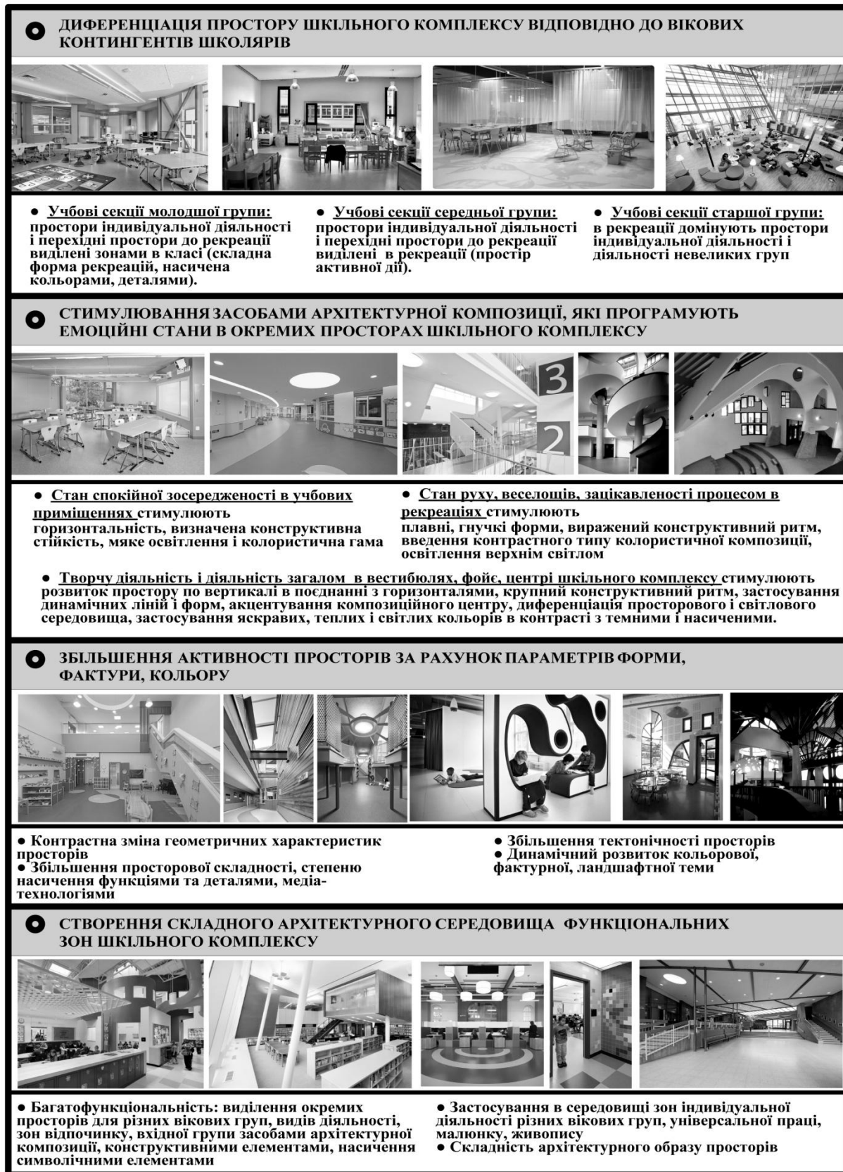
Рис. 1. Особливості архітектурного простору шкільного комплексу