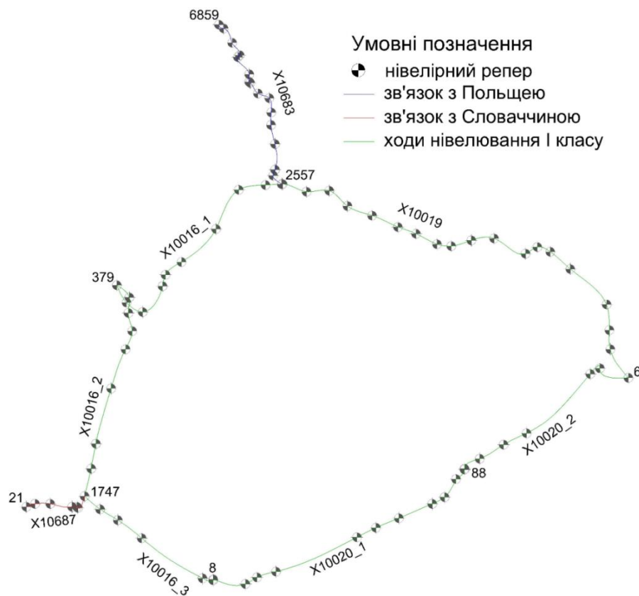
Рис.3. Схема ходів