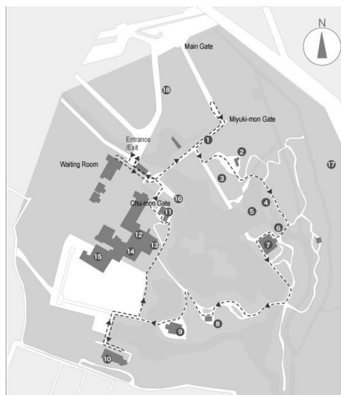
Рис. 2. Схема Імператорської Вілли Кацура [20]

Імператорська Вілла Кацура/Katsura Imperial Villa, Японія, Кіото (рис. 2). Віллу та сад навколо неї побудували о 1624-1629 рр. на замовлення Принца Хачиджо Тосихіто (Hachijo Toshihito) [5]. Її площа складає 6,6 га, розташована біля річки Кацура на південному-заході Кіото. Належить імператорській родині Японії [21].