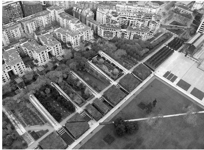
Рис. 4. Вид на Парк Сітроен з пташиного польоту [9]

та срібло), золотий (Сонце та золото). Також у парку є білий та чорний сади – вони знаходяться відокремлено від основних садів, та сад, що рухається [9].