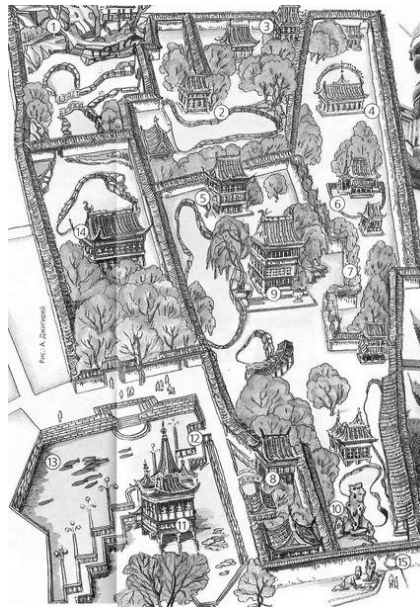
Рис. 1. Схема саду Радості [16]

Сад Радості створений у ландшафтному прийомі планування, його рельєф із перепадами висот.