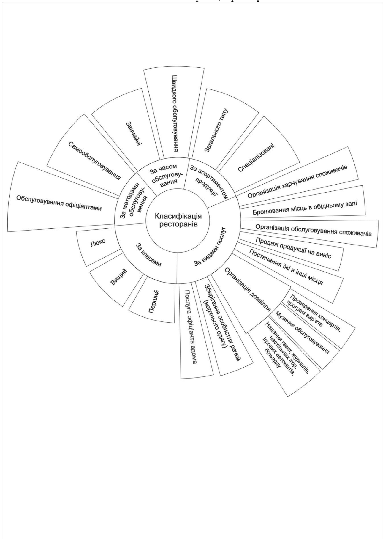
Табл. 1. Класифікація ресторанів