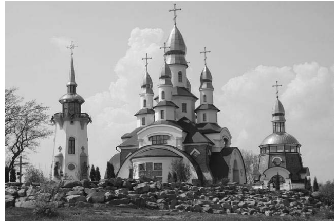
Рис. 1. Прийом історичної стилізації. Собор Святої Трійці, м. Київ. Арх. В. Гречина, І. Гречина.