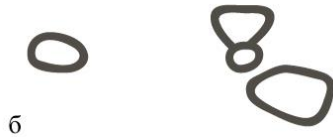
Рис. 1. План м. Києва з 988-1240 рр., укладач Закревський (а) та схема розпланування (б)