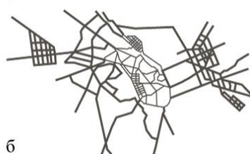
Рис. 4. Генеральний план м. Києва 1936 р.(а) та схема розпланування (б)