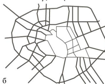
Рис. 5. Генеральний план м. Києва 1966 р.(а) та схема розпланування (б)