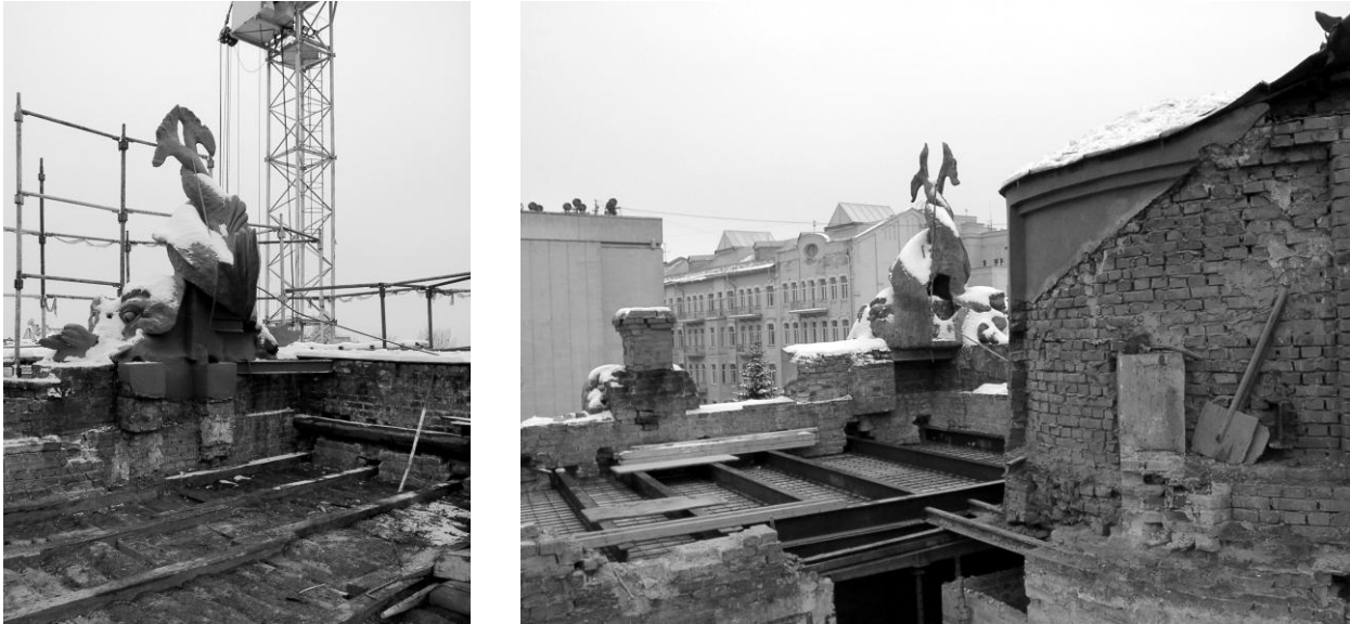
Рис. 1 Будинок з химерами по вул. Банкова 10, стан перекриття даху до- і в процесі реставрації.

Тип 2 – складаються з металевої балки з двотавра, спарених швелерів, рельса, цегляного циліндричного склепіння (XVII-XIX ст.) (Одеський і Київський оперні театри, Національний банк України). Фойє першого поверху Національної філармонії України перекрите профільованими балками [5, с.72].