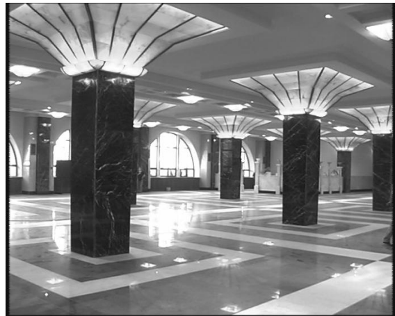
Рис 3. Київський Залізничний вокзал, зал № 3 в процесі (лютий 2001 р.) та після (серпень 2001 р.) реконструкції.

зали, покриття оббудови сценічної частини було з балок монолітної ребристої плити. Під час обстежень 1995-98 років їх стан був визнаний гостро аварійним, роботи з підсилення перекриттів були віднесені до першочергових.