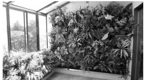
Рис. 4. Варіанти вертикального озеленення приміщень готельного комплексу.

Для вертикального озеленення використовують в'юнкі рослини ( спаржа , плющ звичайний , традесканція , сеткреазія , сциндапус , офітум ). Найпростіший варіант вертикального озеленення - це розміщення на рівні підлоги окремих або поміщених в загальну квіточницю горщиків з рослинами, що в'ються. На стіні кріпиться декоративна сітка, за яку будуть чіплятися гілки. При влаштуванні «зелених перегородок і завіс» рослини