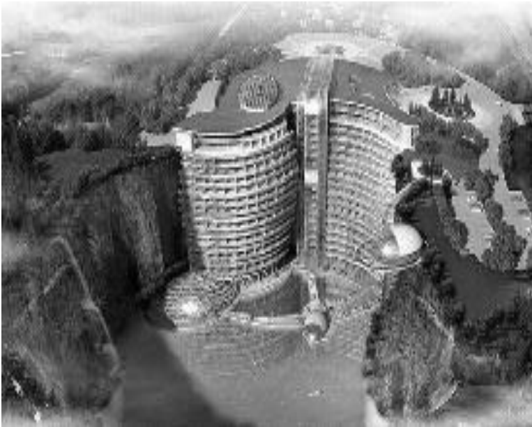
Рис.1. Готель Waterworld в селищі Sjingjiang, Китай.

Готельний комплекс розташовано на екологічно чистій території передгір'я Карпат. Місцевість покрита хвойними лісами, які створюють сприятливий мікроклімат для відпочинку та оздоровлення людини. Це не просто готель, а органічна споруда з усіма енергозберігаючими технологіями для функціонування об'єкта. При створенні архітектурної форми готелю було використано принцип єдності ландшафту і архітектури. Будівля готелю стала не тільки його складовою, але й підкреслює привабливість оточуючого середовища. Озеленення фасаду будівлі передбачає застосування технології постійної підтримки життєдіяльності рослин, автором якої є відомий дизайнер Patric Blanc. Система озеленення складається з каркасу на основі металевих профілів і полімерних матеріалів та мінерально-ватного покриття зі спеціальними отворами, в які висаджують рослини. За допомогою системи трубок відбувається крапельний полив і подача рідких добрив. На даху розміщені геліоустановки та рухливі сонячні панелі.