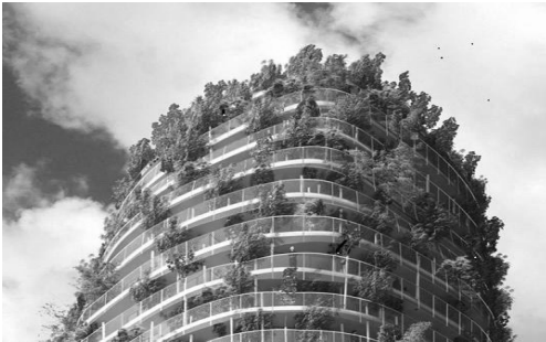
Рис.2." Квітова башта" Едуарда Франсуа, Франція.

Для внутрішніх перегородок передбачено застосування гіпсових плит та гіпсокартонних листів на каркасі з профілів на основі тонколистової сталі.