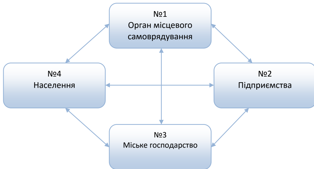
Рис.2. Взаємозв'язок та взаємовплив елементів моделі «Місто».

Елемент №3 «Міське господарство» здійснює експлуатацію житлового фонду, технічне обслуговування, реконструкцію та поточний ремонт об'єктів, надає житлово-комунальні послуги, та ін.