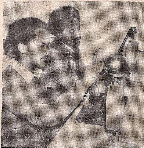
На лабораторных занятиях.

В подготовке страницы принимала участие ст. преподаватель кафедры русского языка № 1 А. В. Онкович.