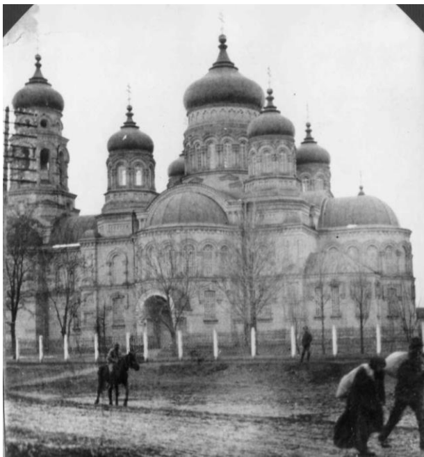
Рис. 3. Вигляд на головний фасад собору.

Після війни Свято-Успенський собор залишився діючим. Але весь час був під пильним наглядом правоохоронних та ідеологічних органів.