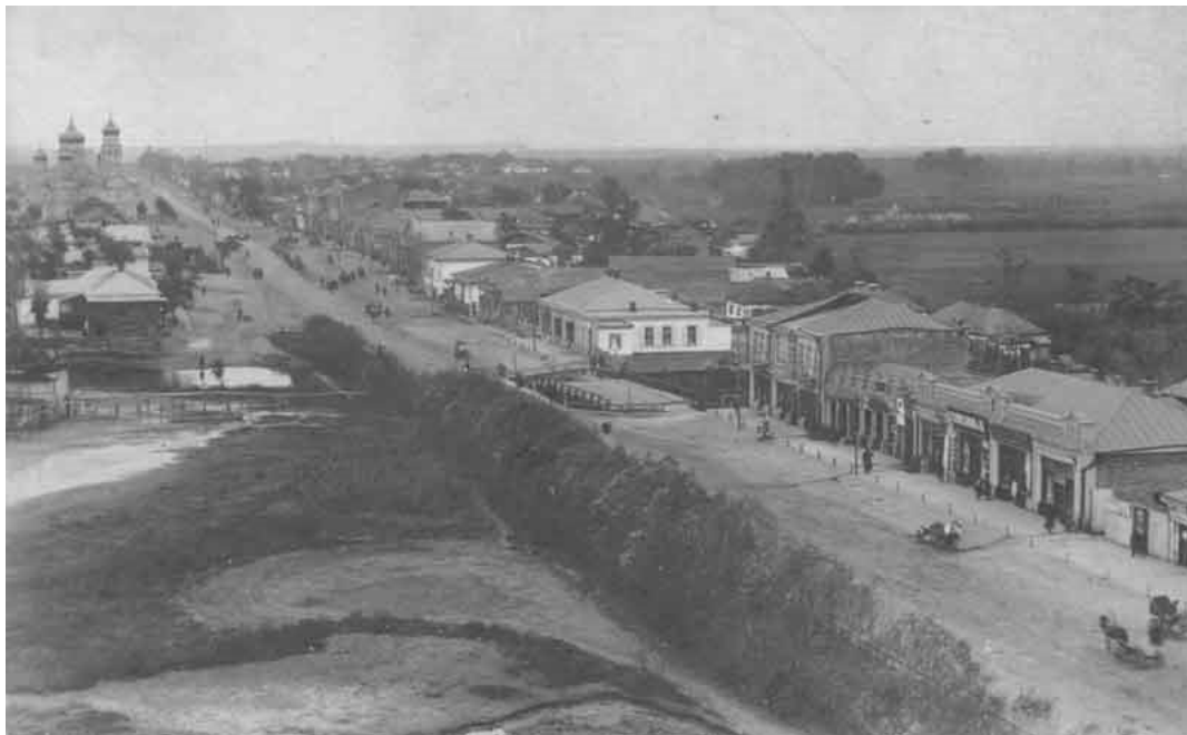
Рис.1.Центральна вулиця м. Золотоноша, 1905 рік.

Увагу кожного, хто проїздить центральною вулицею Золотоноші, привертає величний кам'яний храм, розташований при самій дорозі. Ця архітектурна споруда, збудована на початку 20-го століття, є самою видатною архітектурною пам'яткою міста. Два роки тому храм відсвяткував своє століття. Хоча вік цього храму порівняно невеликий, історія церкви є набагато давнішою.