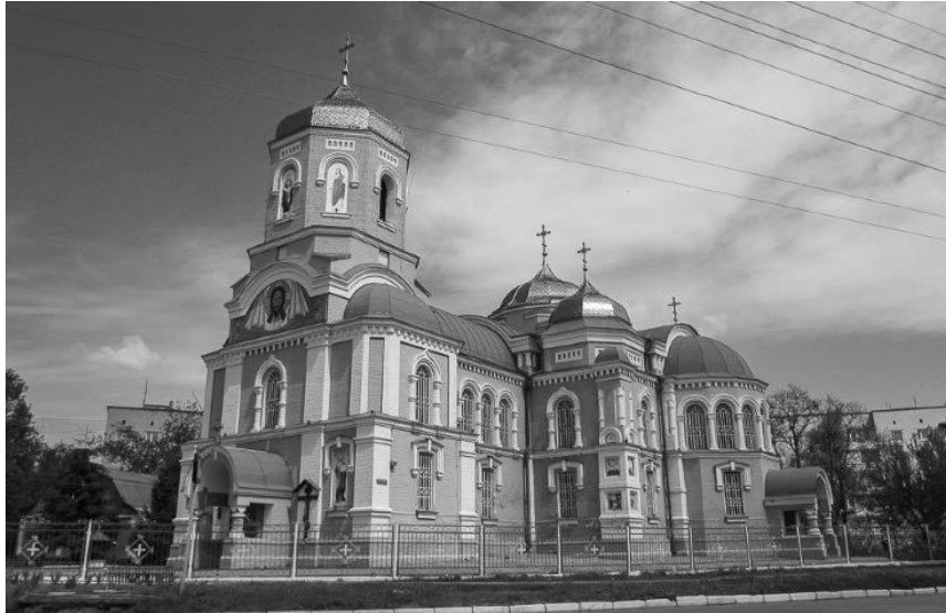
Рис.5. Успенський собор, вигляд з головної вулиці.

Стиль будови, як його визначають архітектори, еклектичний цегляний з домінуванням російсько-візантійського стилю - це чітко видно у ярусах дзвіниці, формі куполів, окресленні вікон і рішенні входу.