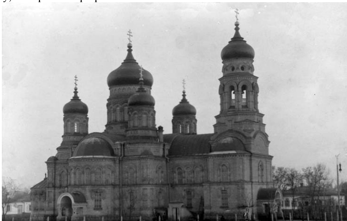
Рис.2. Новий цегляний храм Успенського собору.

Саме ним того ж року розпочалось будівництво нового, уже цегляного храму, яке тривало три роки.