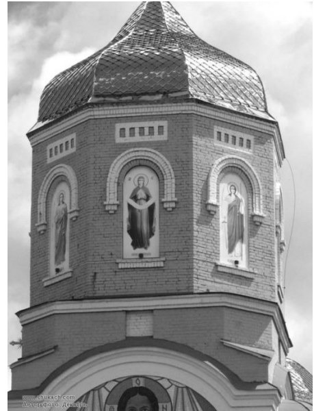
Рис.7. Барабан над головним входом.

Глава в храмі була з декоративним покриттям, яке розташовувалось над куполом і влаштовувалось на світловому барабані. Бокові главки і барабан були декоративні (глухі). Бокові главы храму великі за розміром і повторюють форму основної бані. Малі бані такої форми у візантійській архітектурі називаються конхами.