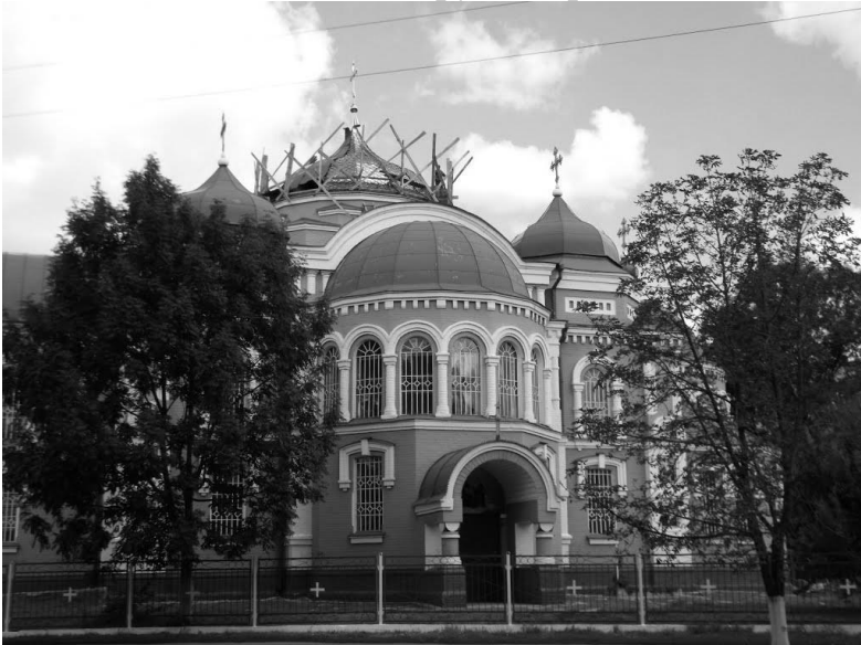
Рис.6. Монтаж центрального куполу храму.

викладені по опалубці, що спирається на кружала і стіни на знижені по відношенню до них підпружні арки.