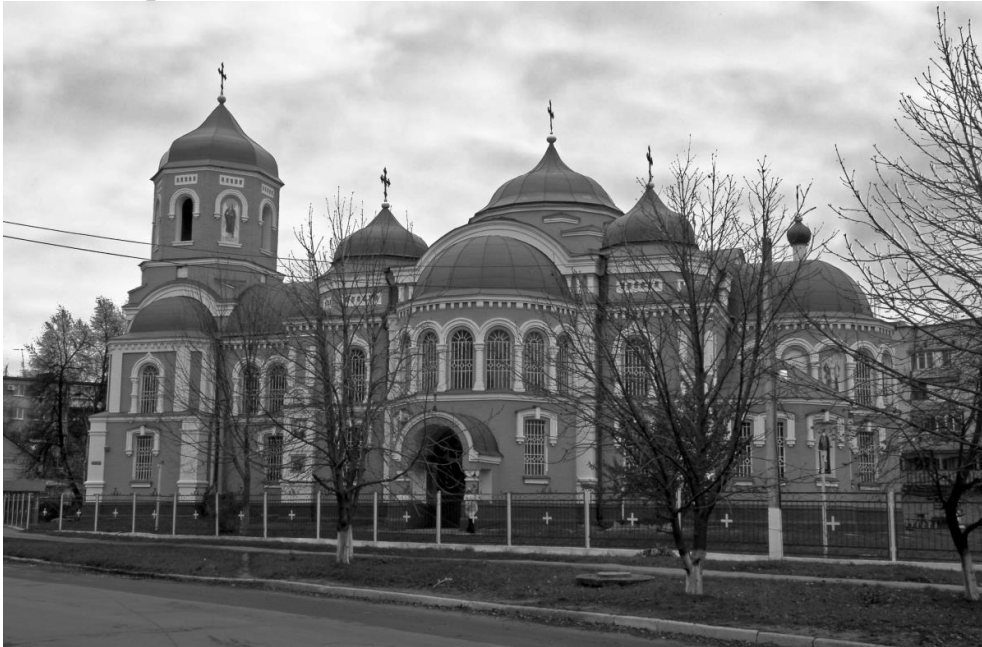
Рис. 9. Сучасний вигляд Успенського собору.

Від невеликого кладовища, розташованого за вівтарною стіною собору, сьогодні залишилася лише могила одного з настоятелів. А в пам'ять усіх, хто знайшов тут вічний спокій, кілька років тому на місці зруйнованого цвинтаря було поставлено хрест.