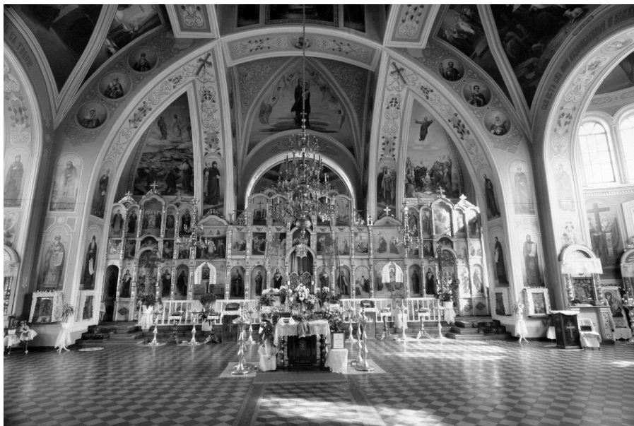
Рис.8. Вигляд храму зсередини.

Глава в храмі була з декоративним покриттям, яке розташовувалось над куполом і влаштовувалось на світловому барабані. Бокові главки і барабан були декоративні (глухі). Бокові главы храму великі за розміром і повторюють форму основної бані. Малі бані такої форми у візантійській архітектурі називаються конхами.