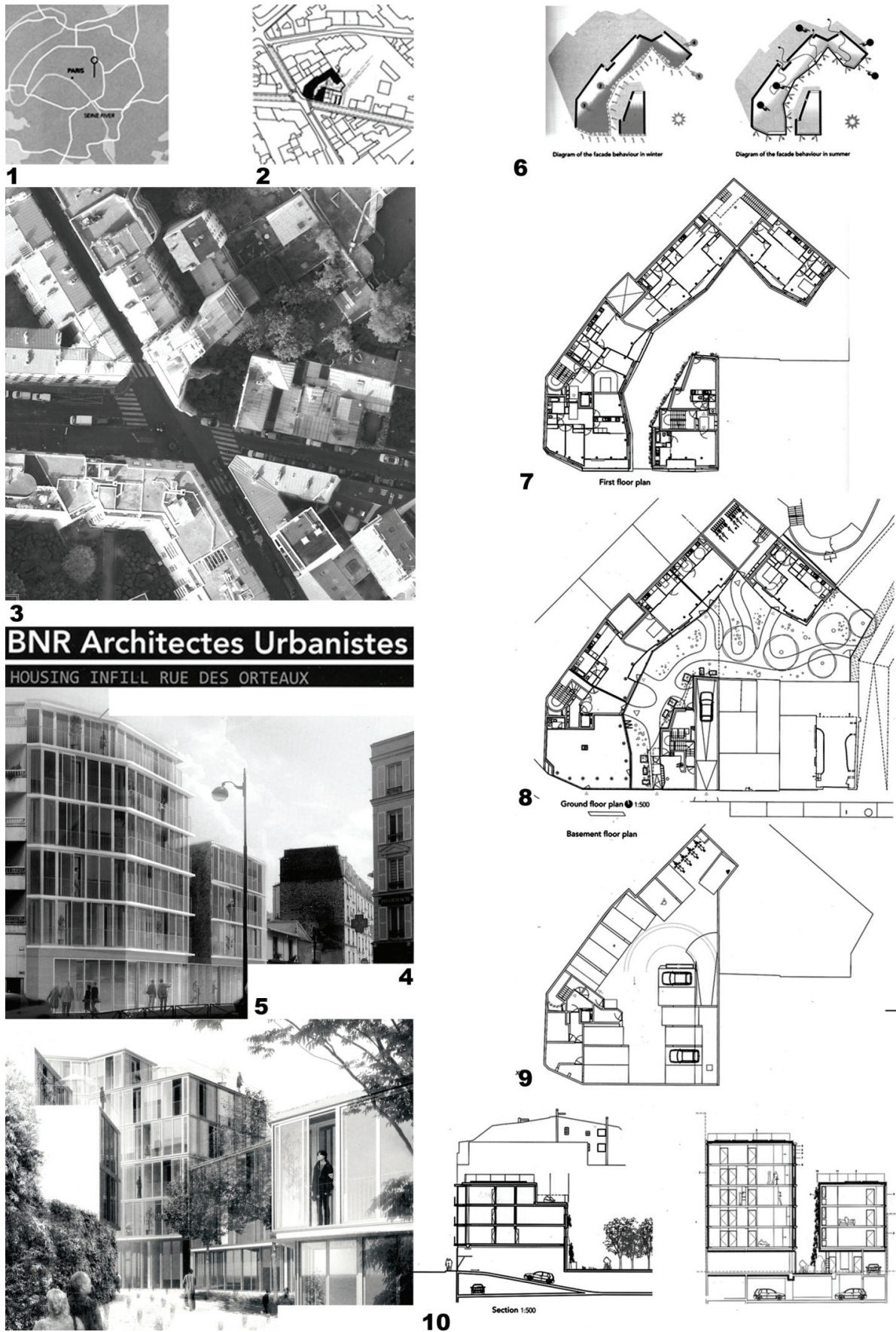
Рис. 1. Жилой дом –«заполнение» (Housing infill), Rue des Orteaux, Paris, 2007-2011, арх.бюро BNR Architectes Urbanistes.