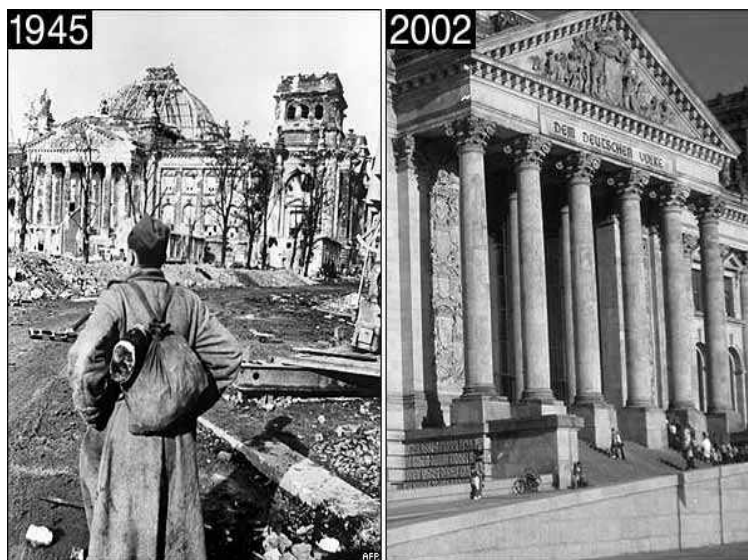
Рис 1. Фото рейхстагу м. Берлін під час бомбардування 1945 р. і після відбудови

Виклад основного матеріалу. Відновлення зруйнованих європейських міст після другої світової війни відбувалося в певній хронологічній послідовності.