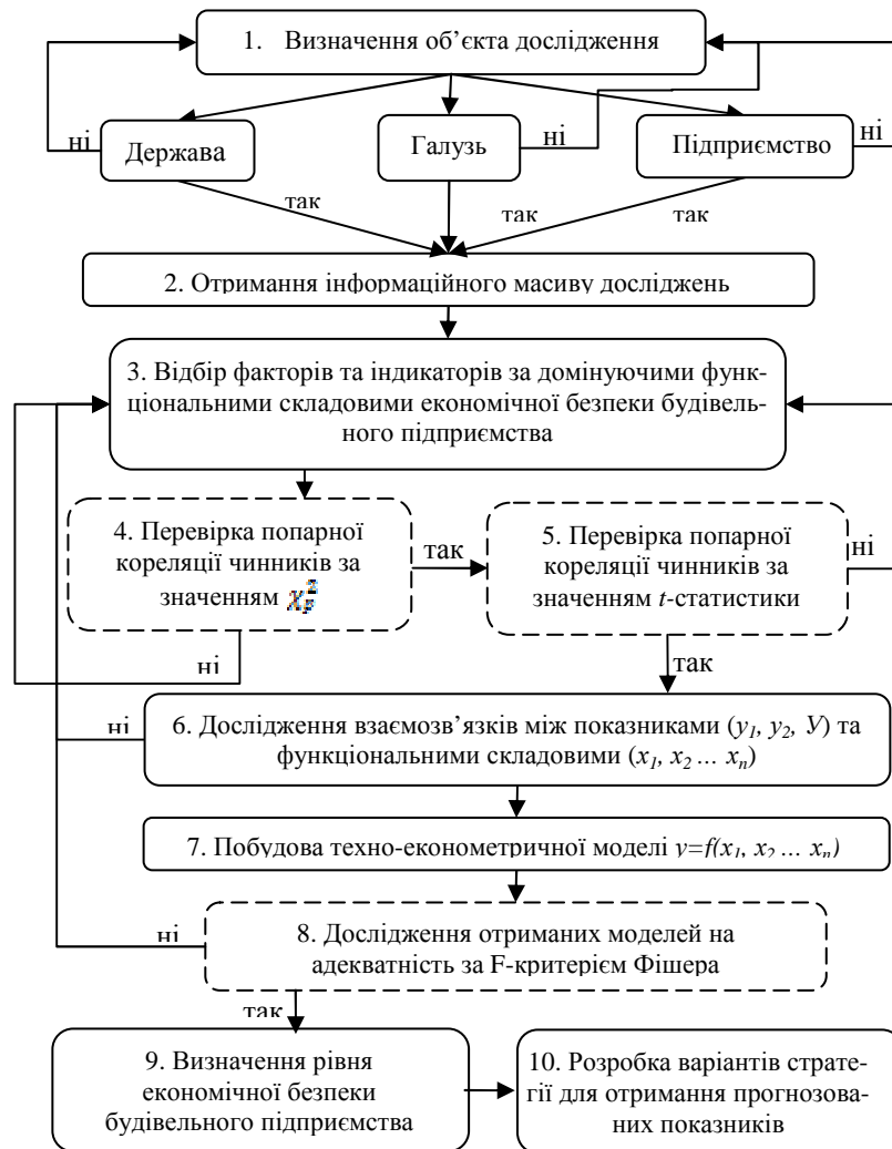
Рис. 1. Схема визначення рівня економічної безпеки.