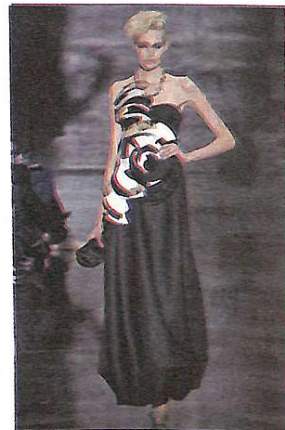
У моді чорно-біла гамма

Однотонний тренд – смугасті речі. Тигр вітає поклоніння і наслідування. Причому, не йдеться лише про чорно-білу гамму, в моді рожеві і сріблясті відтінки, для тих, що народилися під знаком Близняків, можна надіти блакитні речі. Смугастим тільникам цього сезону віддали пріоритет багато будинків моди, у тому числі DKNY, до речі, дизайнери цієї компанії повністю спростували слух про те, що такий одяг повнить, нині