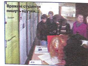
Вражні студенти пишуть відгук...

Всі біографічні історії написали добровольці, переважно школярі, студенти, фахівці різних професій. Вони працювали у сім'ях з безпосередніми очевидцями, вивчали їх приватні архіви, документи, які зберігаються у державних архівних установах. Український проект "Книга пам'яті в'язнів концтабору Дахау" тривав у 2006–2007 роках, в ньому взяло участь 40 учасників із Києва, Львова, Полтави, Харкова, Вінниці, Сімферополя та Перевлеса-Хмельницького. Загалом вдалося записати понад 50 інтерв'ю з колишніми в'язнями, 17 біографічних історій поповнили експозицію "Книги пам'яті".