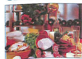
Почнемо з його прикраси. Цього року одним з головних атрибутів новорічного декору стають свічки. Вони ма-

ють бути двох кольорів, переважна гамма – смужка, золото, пурпур або чистий білий. Накрийте стіл скатертиною, поставте свій кращий сервіз, при цьому, не забудьте про символіку року, що надходить. Улаштуйте в центрі одну велику фігуру Тигра або розставте між блюд декілька маленьких. Можна придбати серветки із зображенням цього звіра – тех вийде оригінально.