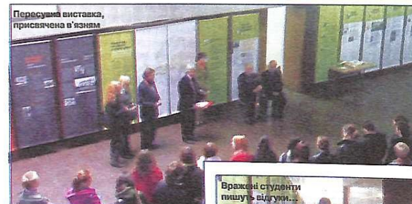
Пересувна виставка, присвячена в'язням