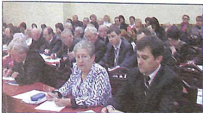
Під час роботи конференції