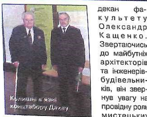
Колішні в'язні концтабору Дахау

Виставка "Імена замість номерів" складається з 22 біографій невеличких з багатьох європейських країн і національностей. Вони дуже різні, єдине, що для них є спільним, – це концтабір Дахау, де за 12 років із 200 тис. полонених, загинуло 43 тисячі. Українські в'язні становили у концтаборі одну з найчисельніших груп. Це були військовополонені, діти ОУН, учасники антифашистського руху Опо-