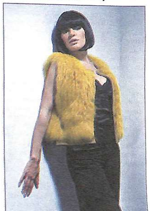
Мехова жилетка дуже популярна серед жінок