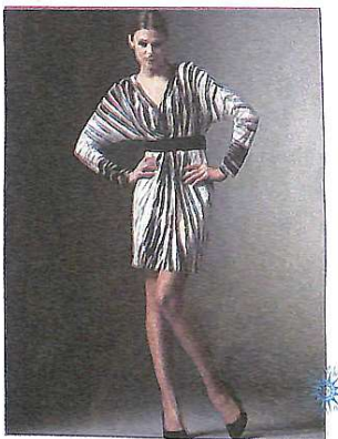
Смугасті речі на піку