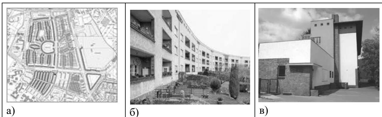
Рис. 2. Житловий район «Хуфайсен» в Берліні (1930 р., арх. Б. Таут):

Реновація із збереженням первинного вигляду характерна для житлових районів, внесених до списку всесвітньої спадщини ЮНЕСКО (рис.2, а, б). Охоронний статус пам'ятки обмежує будь-яке втручання у зовнішній вигляд будівлі та регламентує заходи з її реновації. В житловому районі «Хуфайзен» в Берліні (1930 р., арх. Б. Таут) виконано санацію фасадів та даху, відновлено первинні кольори та матеріали у відповідності до оригінальних креслень [2]. При цьому органами архітектурного контролю були погоджені зміни в первинних плануваннях квартир для комфортного проживання мешканців шляхом об'єднання дрібних кімнат в загальні відкриті простори, зміни функціонального призначення приміщень, перепланування санвузлів.