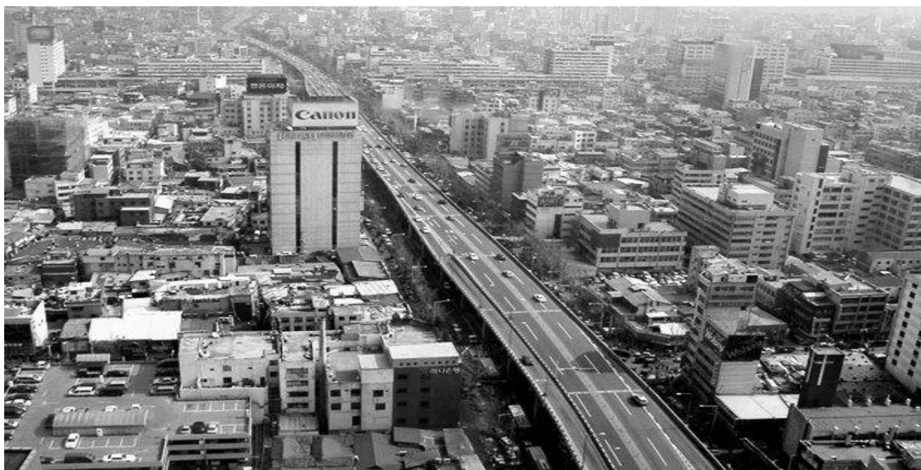
Рис. 2. Набережна річки Чхонгечхон у Сеулі наприкінці XX століття