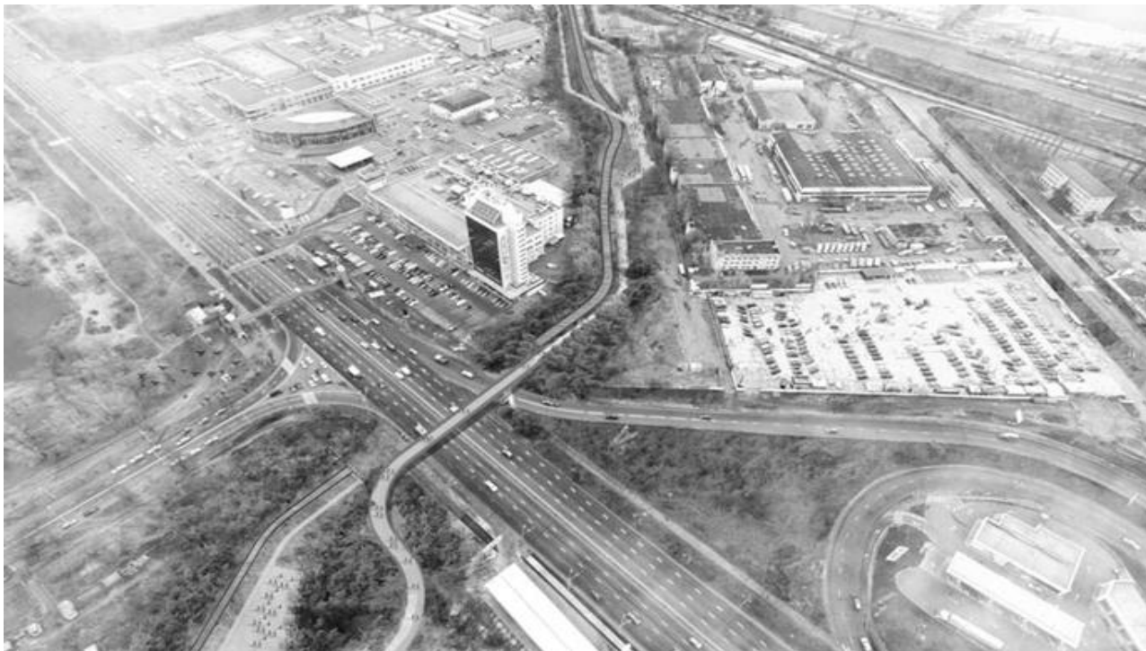
Рис. 4. Концепція Парку Почайна