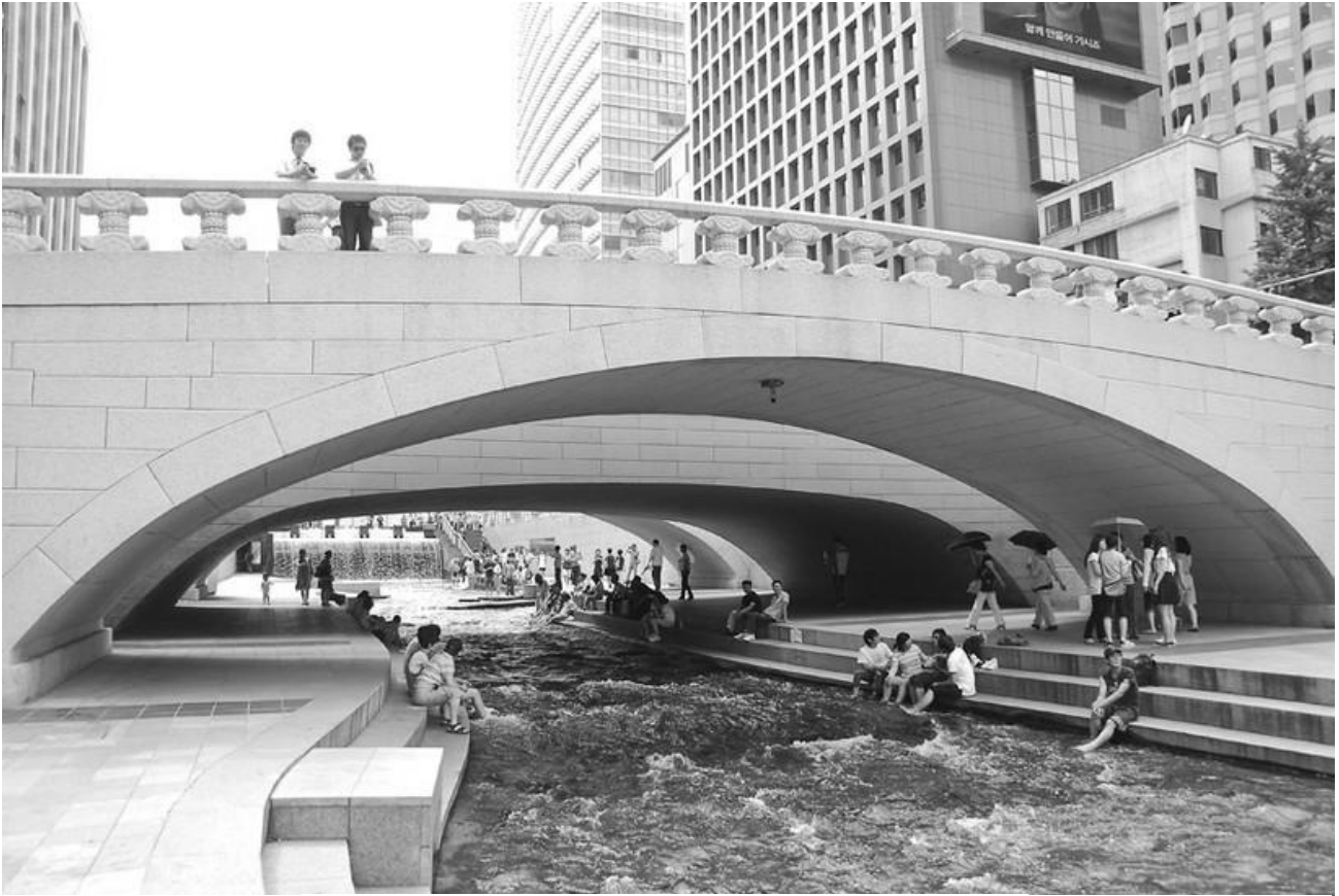
Рис. 3. Набережна річки Чхонгечхон у Сеулі 2017р.

Набережні з пріоритетом для пішохідного руху актуальні у багатьох європейських країнах, зокрема у Німеччині, Фінляндії та Данії. Досить цікавим є проведений нещодавно архітектурний конкурс на концепцію «Парку Почайна», в якому передбачено створення вздовж русла річки пішохідний та велосипедний маршрут та низку громадських просторів. В результаті буде продовжена набережна з Оболоні і прокладений новий маршрут до станції метро Петрівка, а також альтернативний маршрут до торговельних центрів і метро, замість ходу вздовж автомагістралі – проспекту Бандери. Концепція парку полягає в створенні системи громадських просторів – вхідної групи у вигляді пішохідного мостового переходу над проспектом Бандери, далі вздовж річки набережна зона, що переходить в громадський простір, який нині існує на вул. Вербній. Там пропонується зберегти існуючий стінопис.