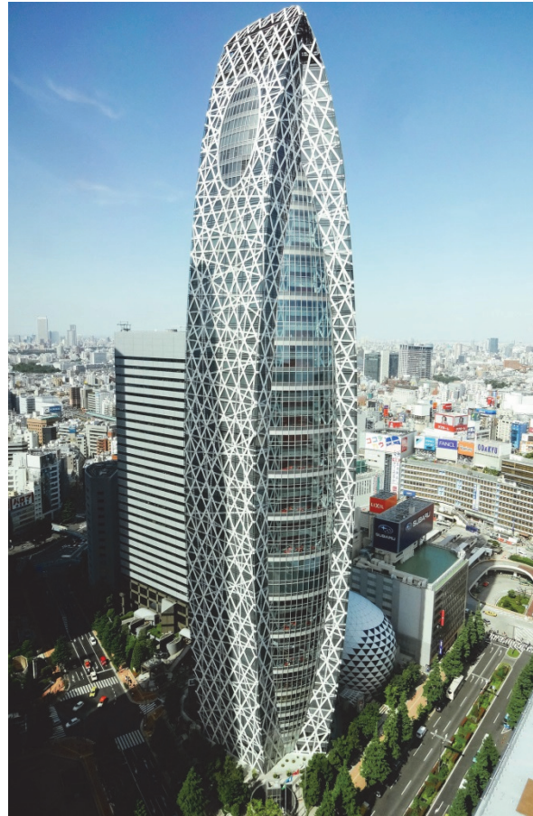
Рис.2. «Mode Gakuen Cocoon Tower». Токіо. Японія. Архітектор: Кензо Танге.

Згідно з дослідженнями вчених кольорова гамма, наявність рослин, комфортність меблів, температура та освітлення приміщення має значний вплив на психологічний стан. Наприклад нормальною температурою для роботи вважається 22 градуси, а світлі тона створюють найсприятливіше перебування. Та в якому стані є насправді інтер'єри українських ЗВО? Розпочинаючи з температури приміщень, що не рідко примушує студентів вчитися у верхньому