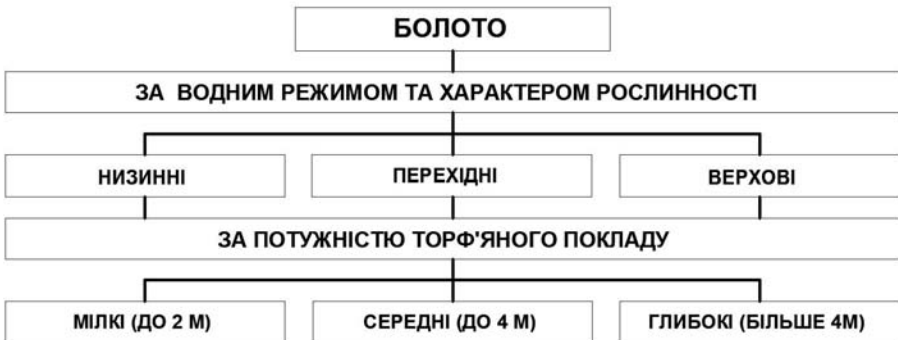
Рис.1. Класифікація боліт.

Розглянемо більш детально основні показники цього процесу, особливості заболочування територій. Різновиди боліт та їхню специфіку за допомогою побудови структурних схем (Рис.1)